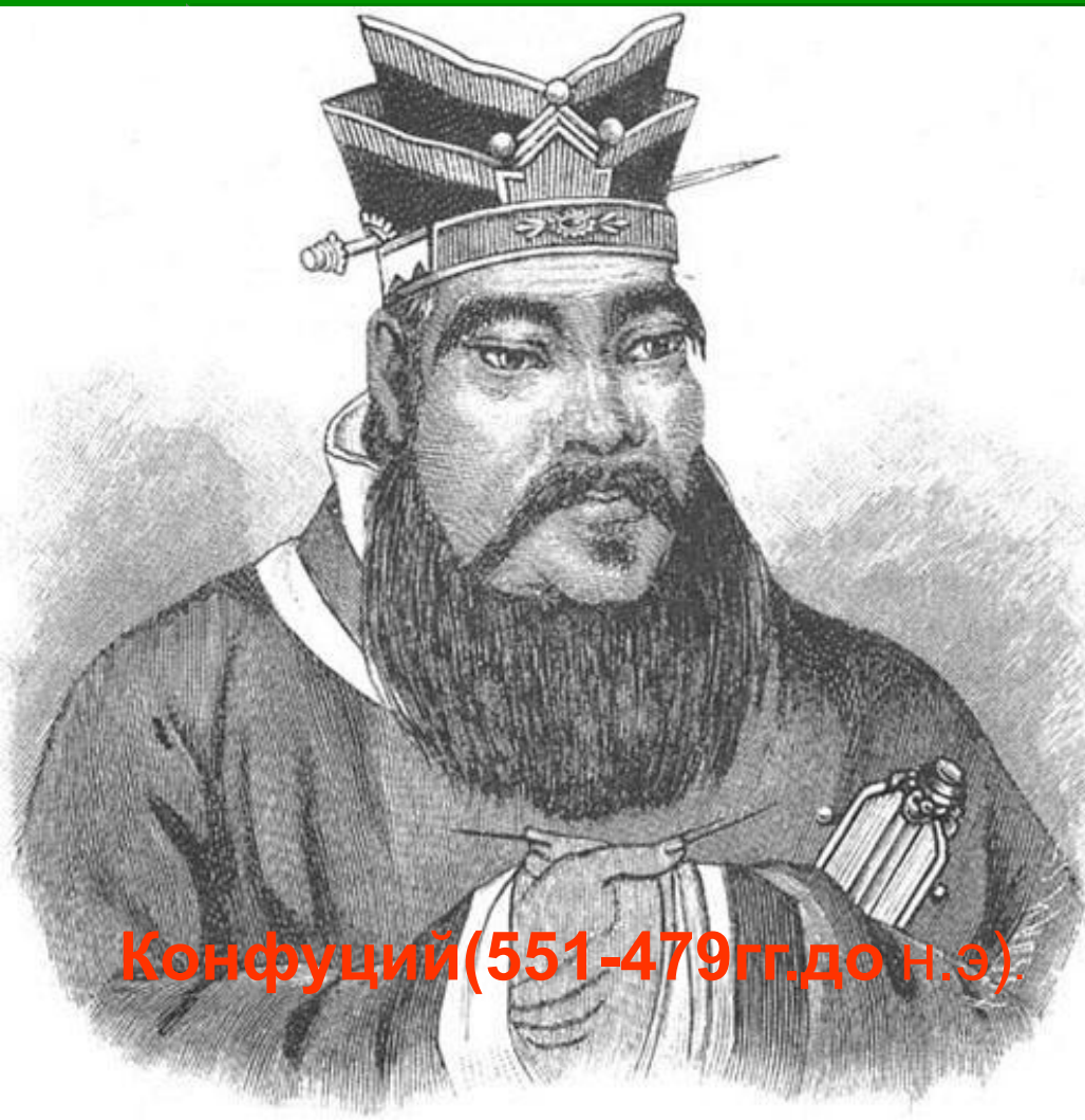
Конфуций (551-479 гг. до н.э.).