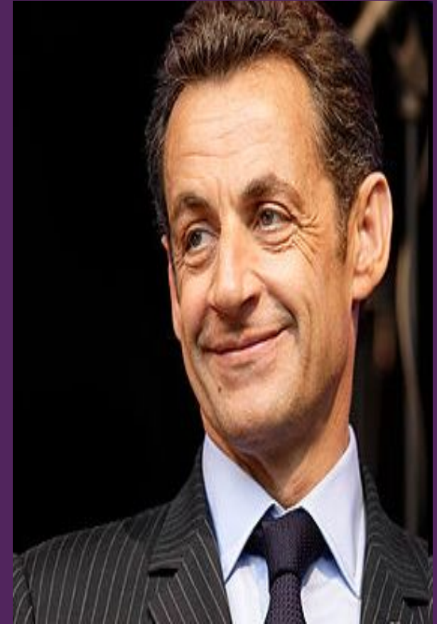
Князь Николя Саркози