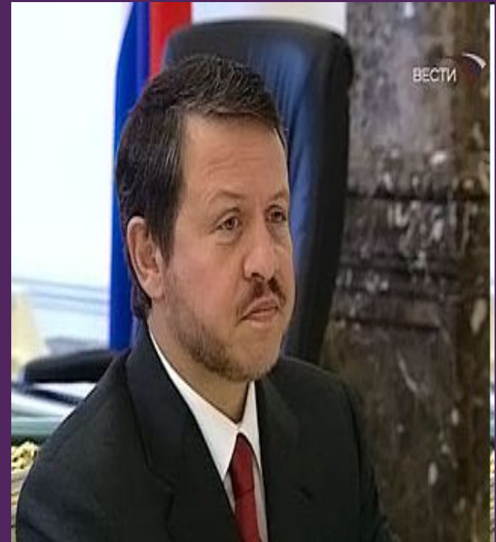
Капитан-регент Франческо Муссони

Герб Сан-Марино появился в XIV веке. Это символ свободы и суверенитета самой старой республики в мире.