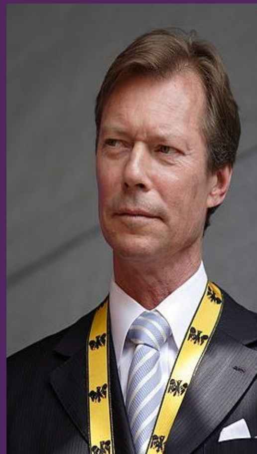
Великий Герцог Анри (Генрих)

Герб представляет собой щит с 10 горизонтальными синими и серебряными полосами. На гербе лев с золотым языком.