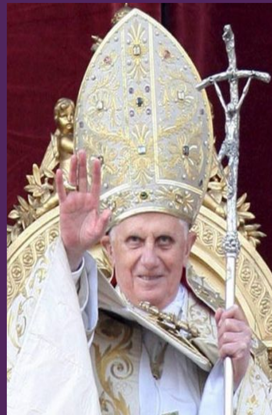
Римский Папа Бенедикт XVI

Герб Ватикана — представляет собой щит красного цвета, на котором изображены два скрещенных ключа (от Рая и Рима). Над ключами расположена папская тиара.