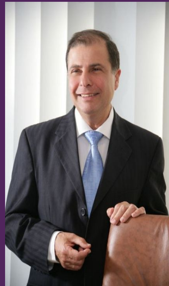
Президент Джордж Абела

Щит, представляющий геральдическое изображение флага Мальты.