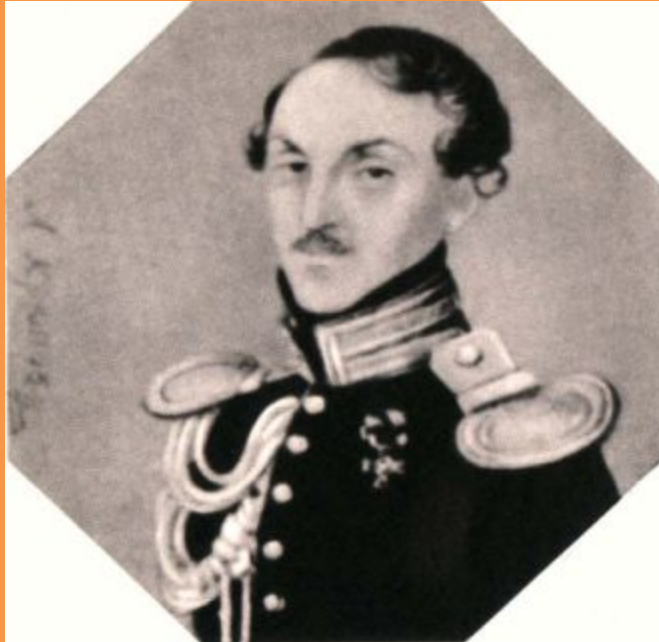
Николай Ильич Толстой, отец Льва Николаевича

Отец писателя – граф Николай Ильич Толстой – в семнадцатилетнем возрасте добровольно поступил на военную службу. Он участвовал в Отечественной войне 1812 года, попал в плен к французам и был освобожден русскими войсками, вступившими в Париж после разгрома армии Наполеона.