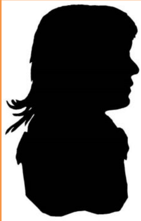
Силуэт княжны Марии Николаевны Волконской.