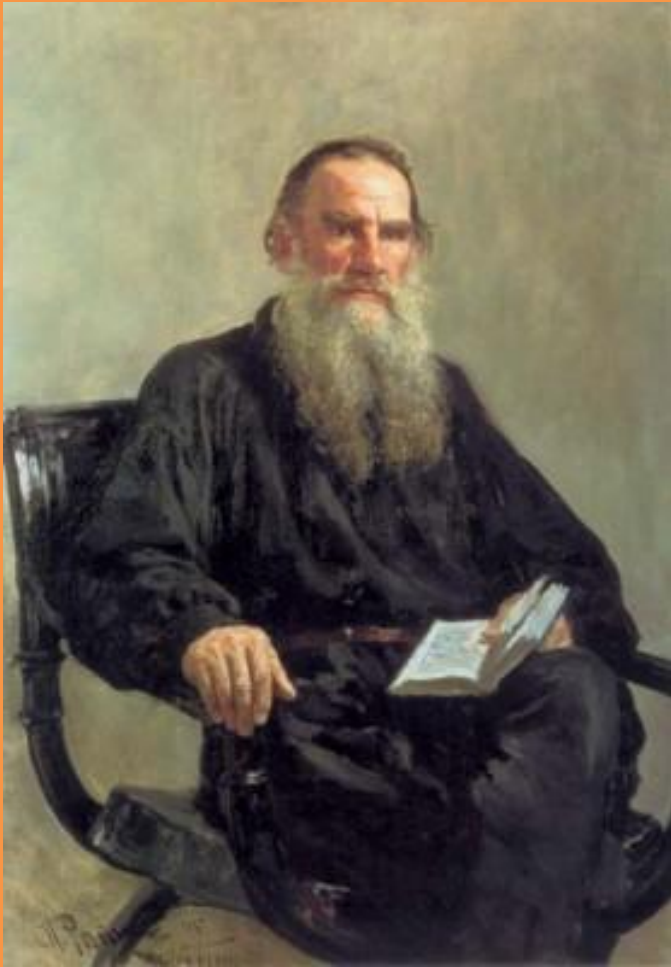
И.Е.Репин. Портрет Льва Толстого, 1887

Л. Н. Толстой, потомственный русский аристократ, потомок старинных дворянских родов по отцовской и по материнской линиям, принадлежал к высшей аристократической верхушке русского дворянства