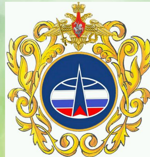
Малая, средняя, большая эмблема Космических войск РФ