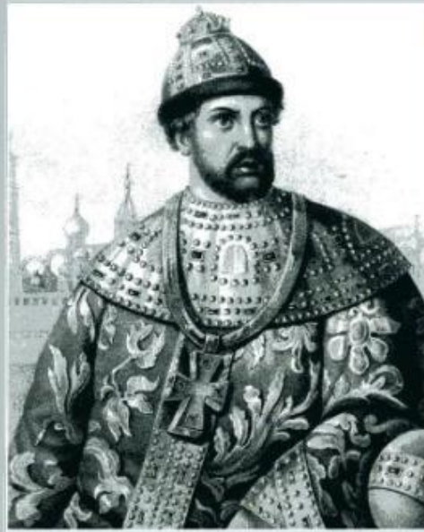
Царь Борис Годунов. Рисовал Златовский.

Борис Годунов , являясь фактически при Фёдоре правителем России, сумел оттеснить от влияния на Фёдора других представителей знати.