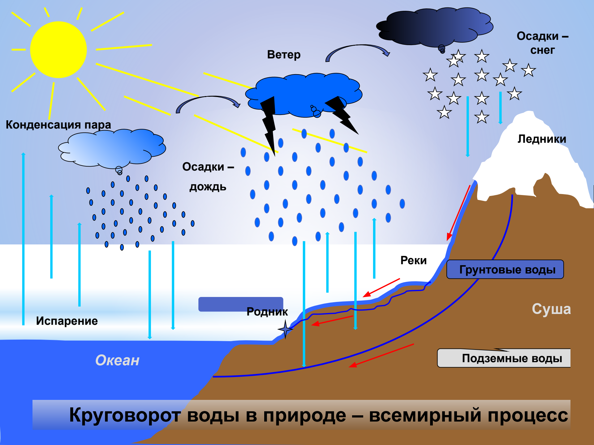
Круговорот воды в природе – всемирный процесс