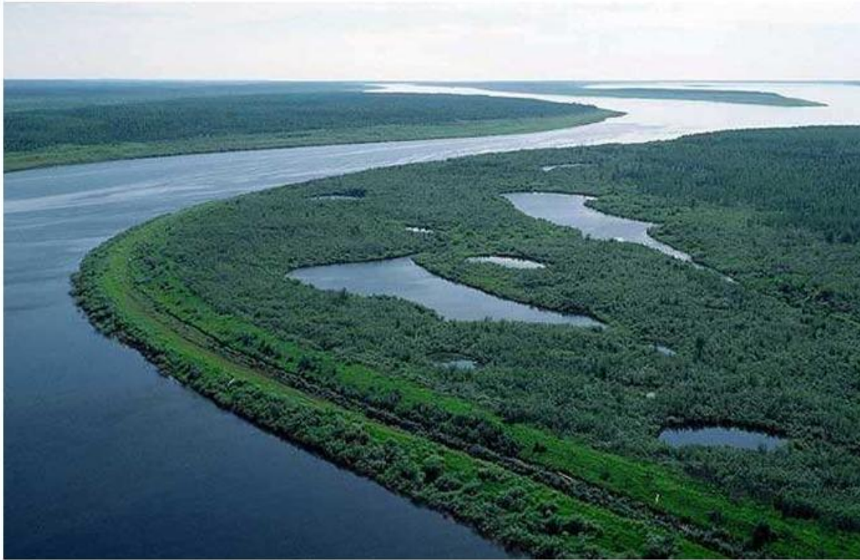
Река Енисей, Россия

РУБЕЖ, НА КОТОРОМ СМЕНЯЕТСЯ РЕЛЬЕФ, НЕДРА, КЛИМАТ , ВОДНЫЙ РЕЖИМ И ЖИВАЯ ПРИРОДА