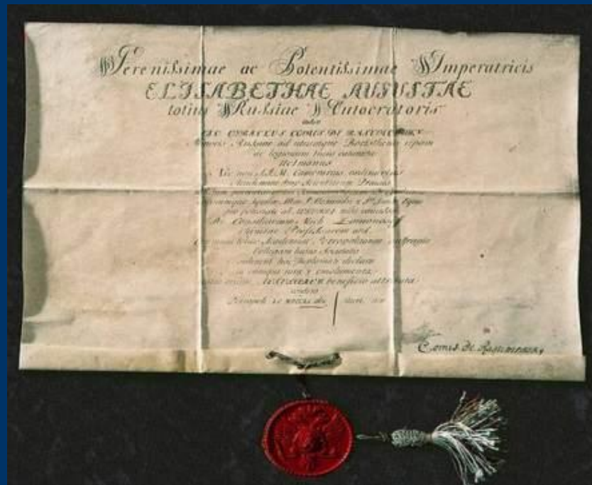
Диплом профессора химии