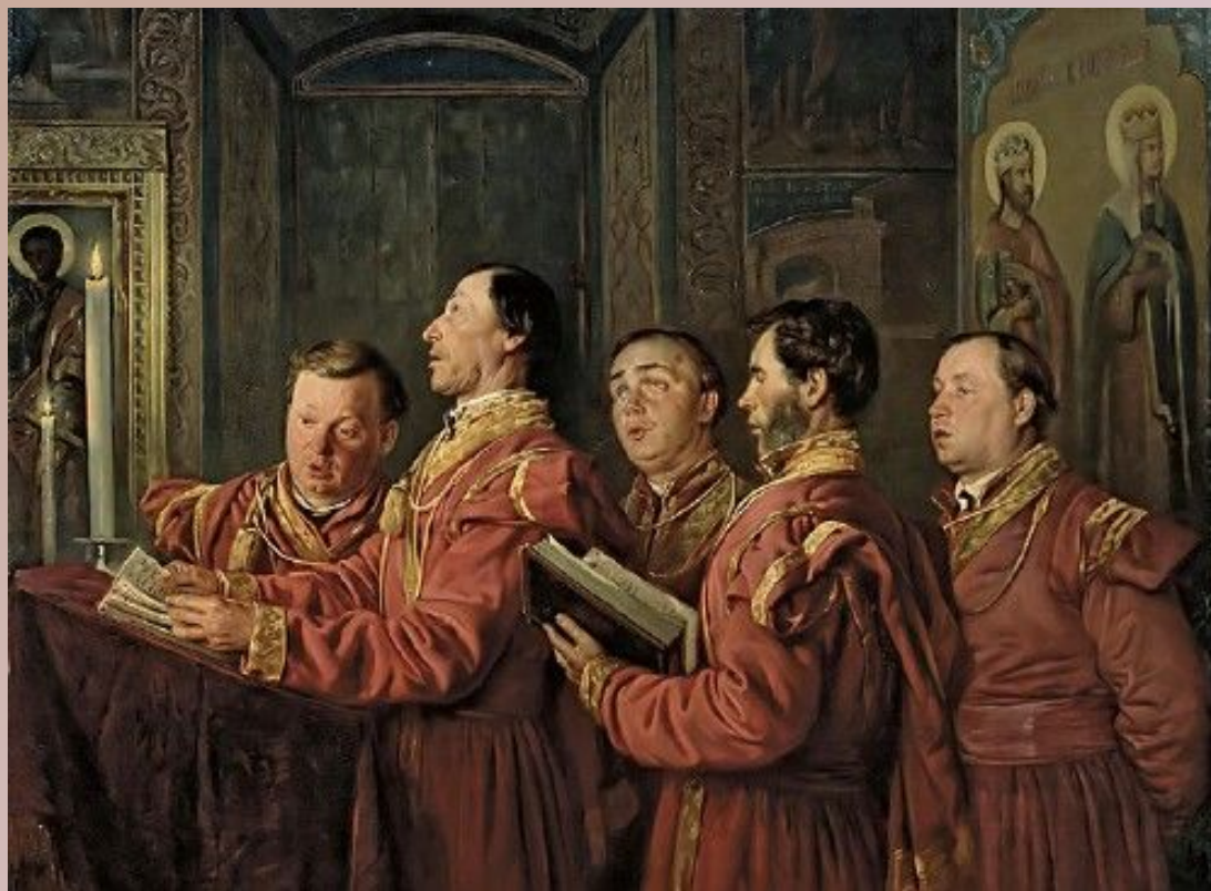
Маковский В.Е. "Певчие на клиросе".1870 год

Атрибутом солидных церковных хоров была единая форма