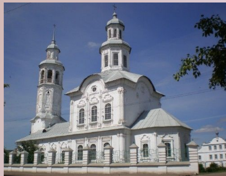
Церковь Троицы Живоначальной, Макарье (1775)