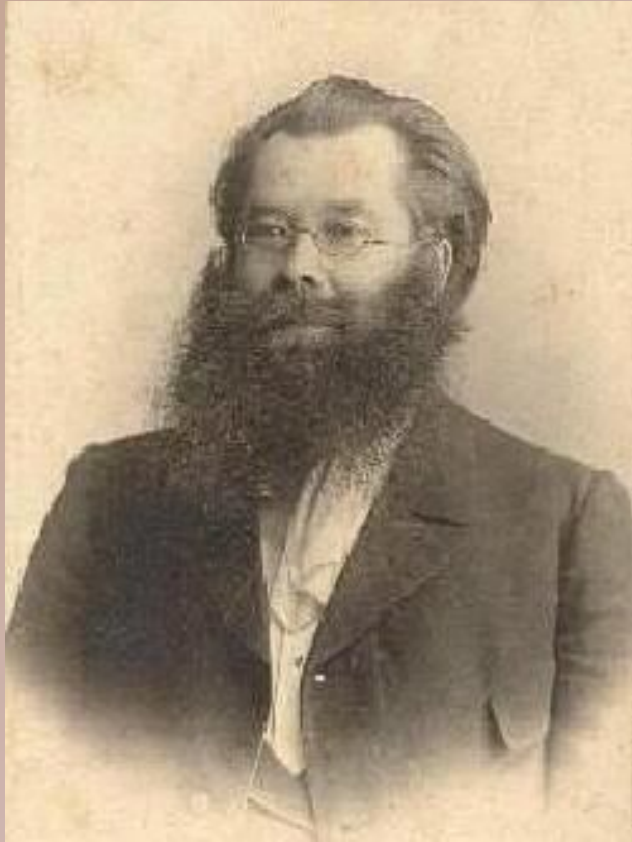
Никанор Степанович Любимов