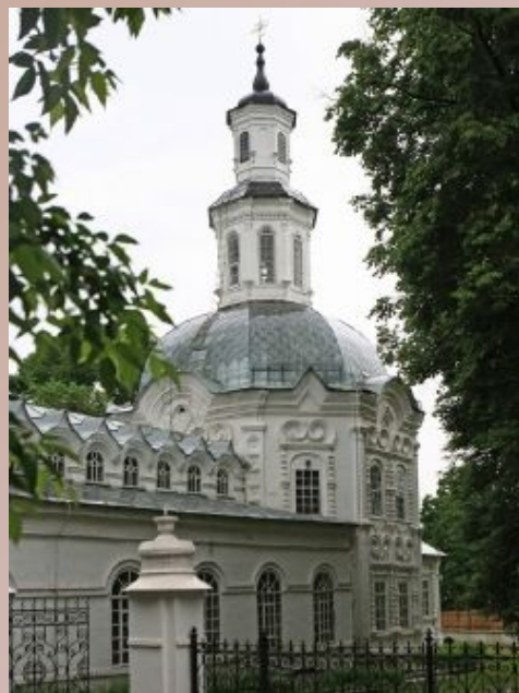
Церковь рождества Иоанна Предтечи (1717)