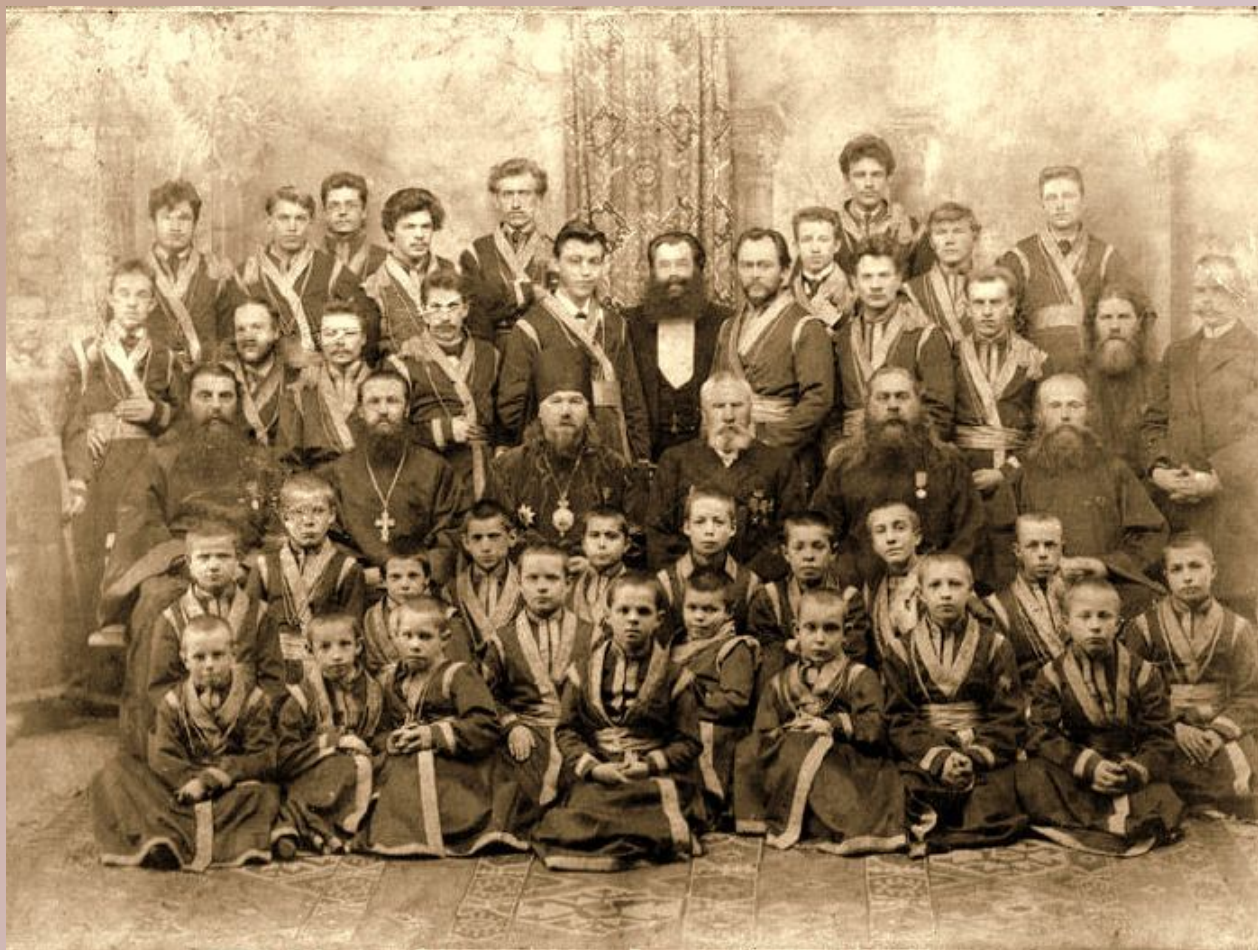
Хор Вятской духовной семинарии, 1900 год