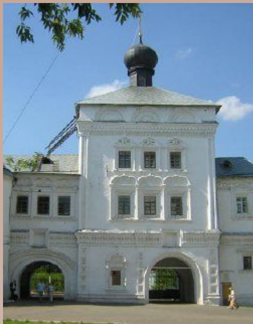
Церковь Николая Чудотворца Трифонова монастыря (1690-1695)