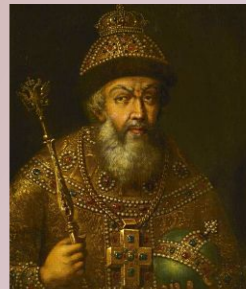
Иван IV Грозный (1530 – 1584)