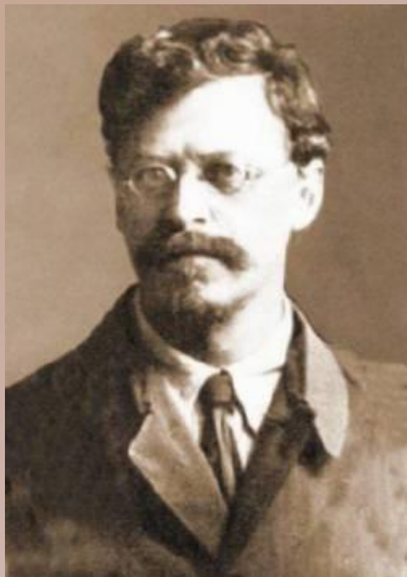
Алексей Алексеевич Игнатъев