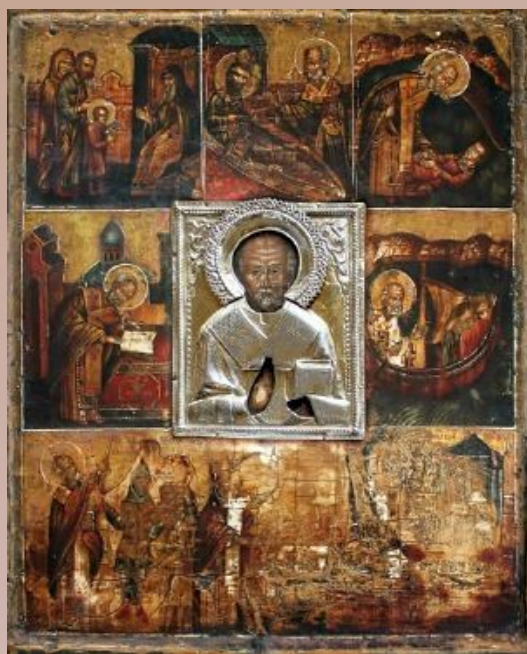
Икона Святителя Николая Великорецкого