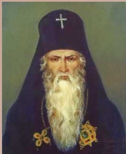
Иона (Баранов) 1674 - 1699