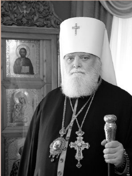
митрополит Вятский и Слободской Хрисанф (Чепиль) † 2011