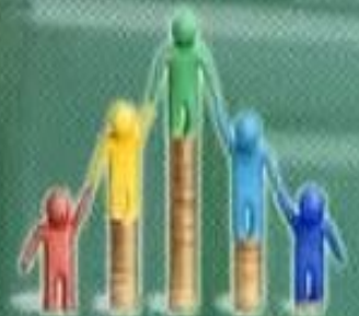
ОРТА ТАП ҚАЗАҚСТАНДЫҚ ҰЛТТЫҢ НЕГІЗІ