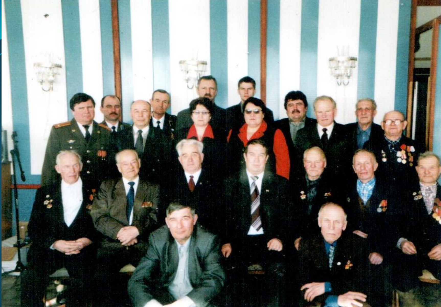
СОБРАНИЕ АКТИВА БОЛЬШЕИГНАТОВСКОГО РАЙОНА В ЧЕСТЬ 55-ЛЕТИЯ ВЕТЕРАНСКОГО ДВИЖЕНИЯ РОССИИ. 29 сентября 2011 г.