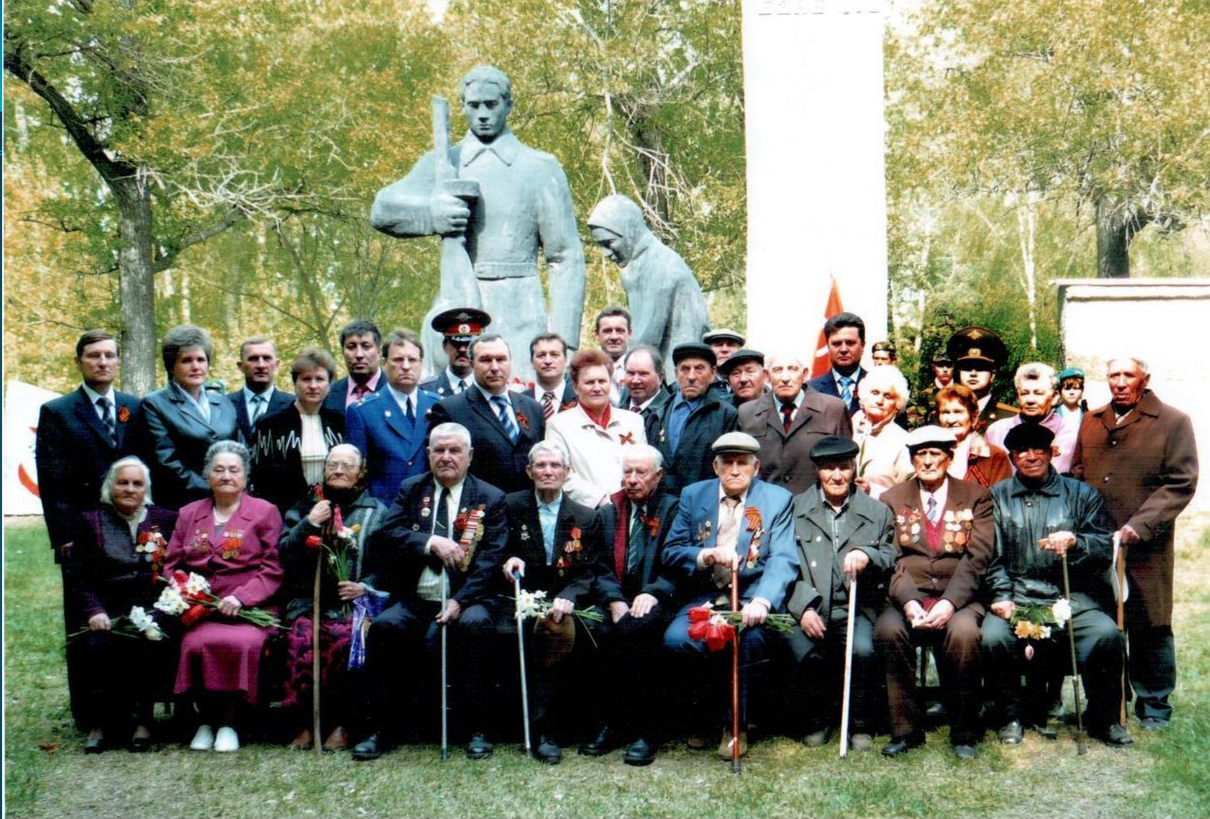
ВЕТЕРАНЫ РОМОДАНОВСКОГО РАЙОНА В ДЕНЬ ПОБЕДЫ У ПАМЯТНИКА ПОГИБШИМ ВОИНАМ. 2008 г.