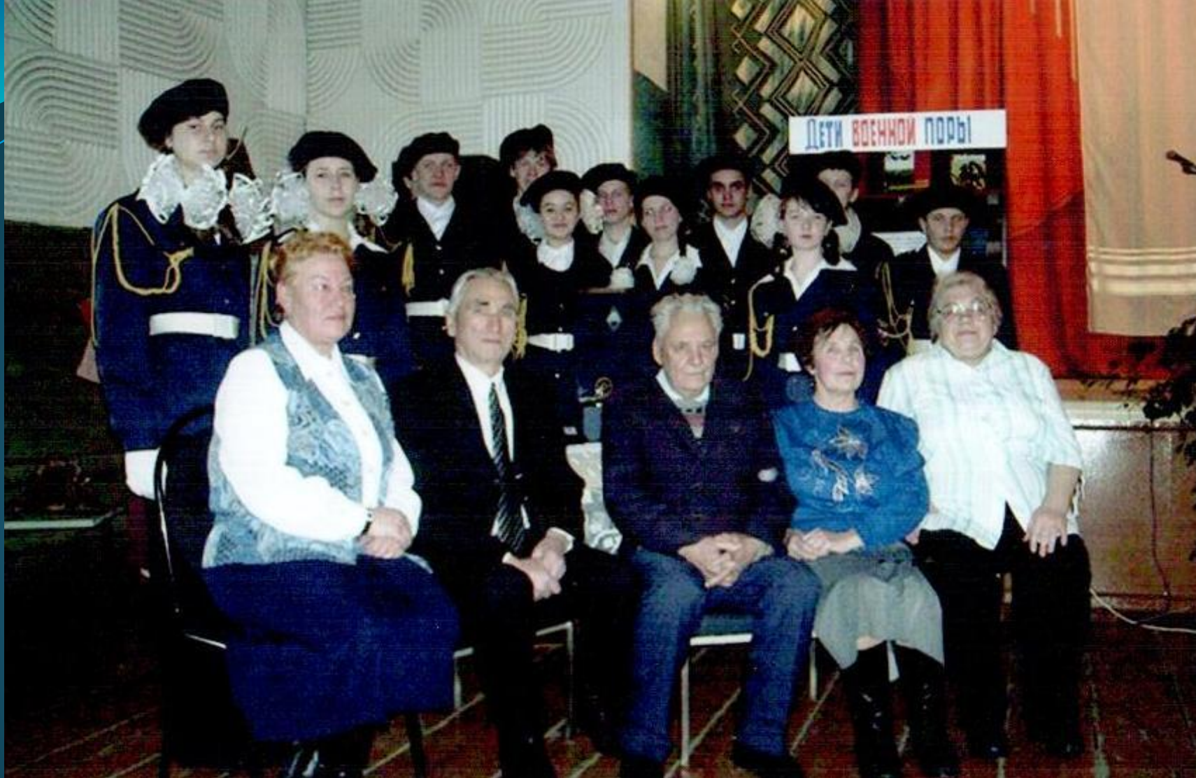
МЕРОПРИЯТИЕ «ДЕТИ ВОЕННОЙ ПОРЫ». с. ЕЛЬНИКИ.