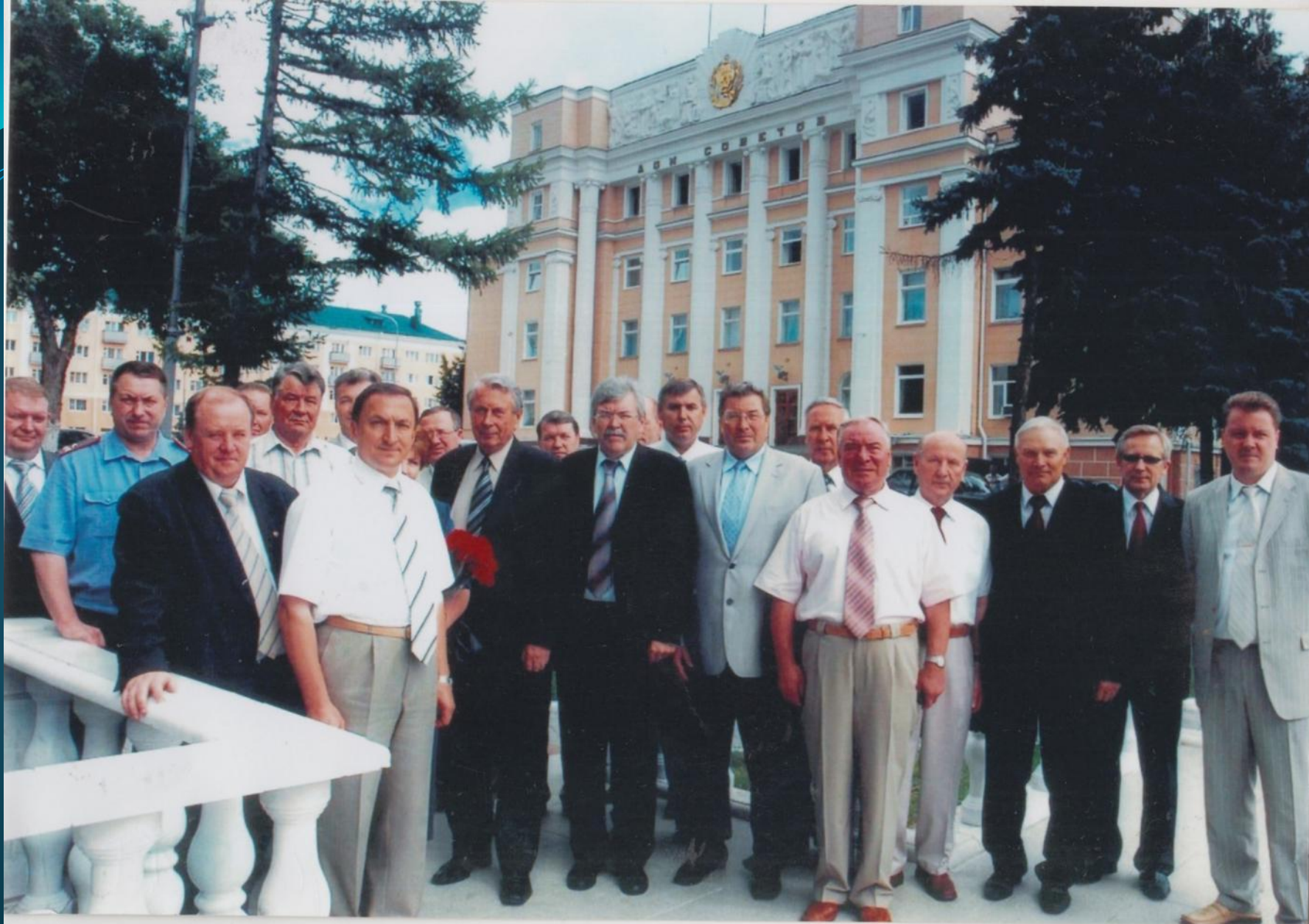
РУКОВОДСТВО МОРДОВИИ С ПРЕДСЕДАТЕЛЕМ ГОСКОМСТАТА РОССИИ В.Л. СОКОЛИНЫМ. 2006 г.