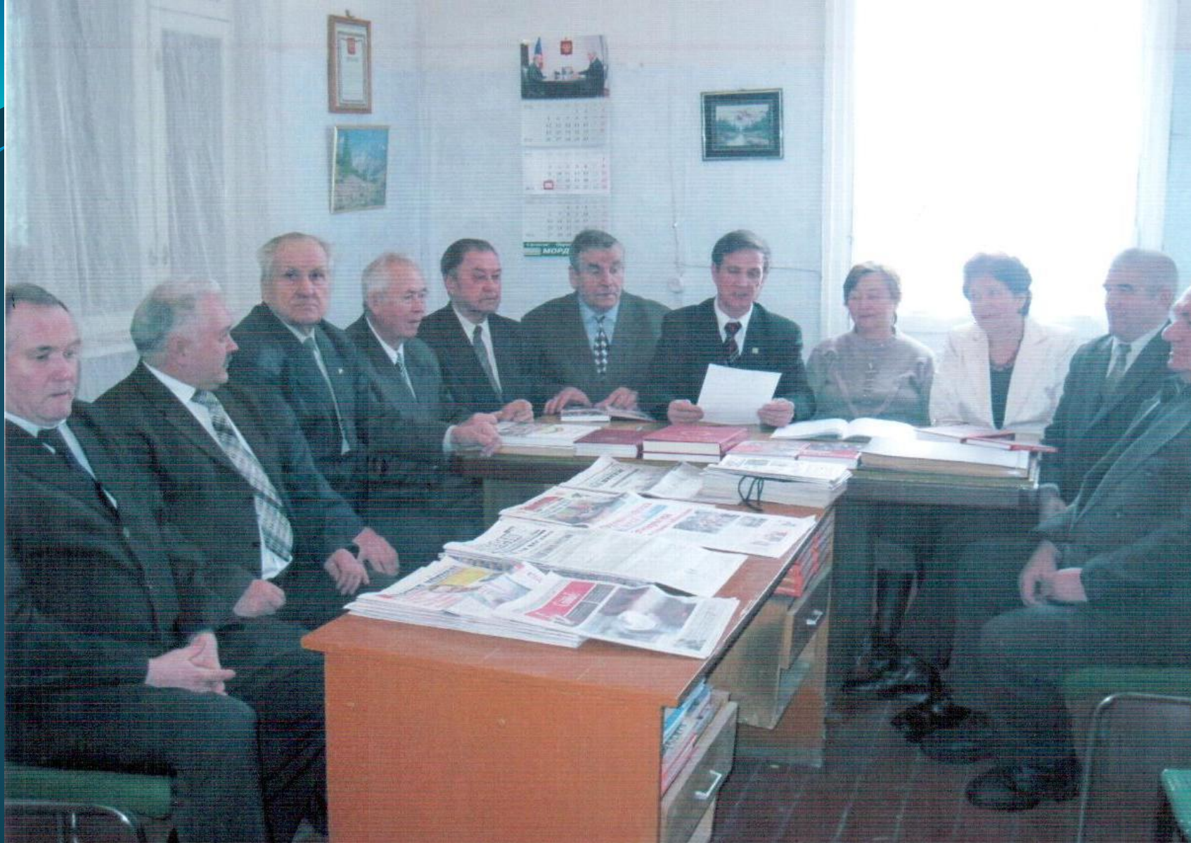
ЗАСЕДАНИЕ ПРЕЗИДИУМА БОЛЬШЕБЕРЕЗНИКОВСКОГО РАЙСОВЕТА ВЕТЕРАНОВ ВОЙНЫ И ТРУДА. 30 января 2012 г.