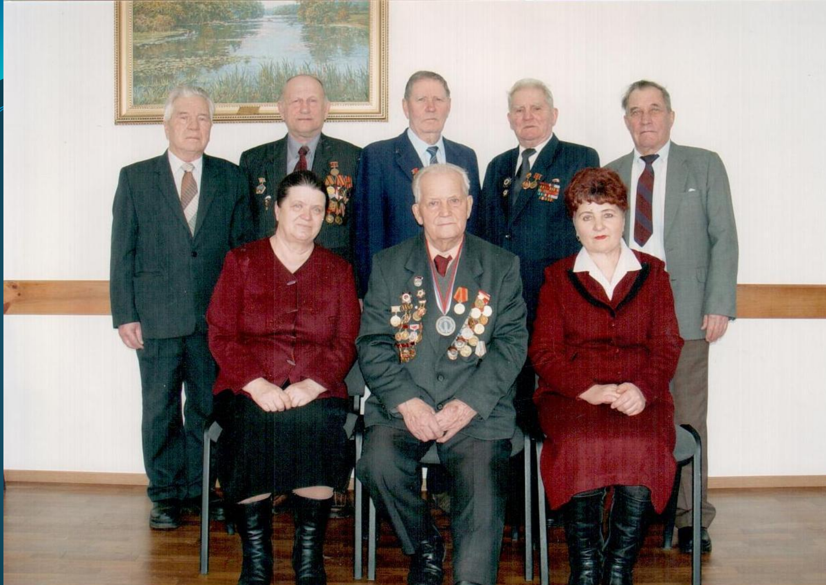
СОБРАНИЕ ВЕТЕРАНСКОГО АКТИВА ИЧАЛКОВСКОГО РАЙОНА В ДЕНЬ ЗАЩИТНИКА ОТЕЧЕСТВА