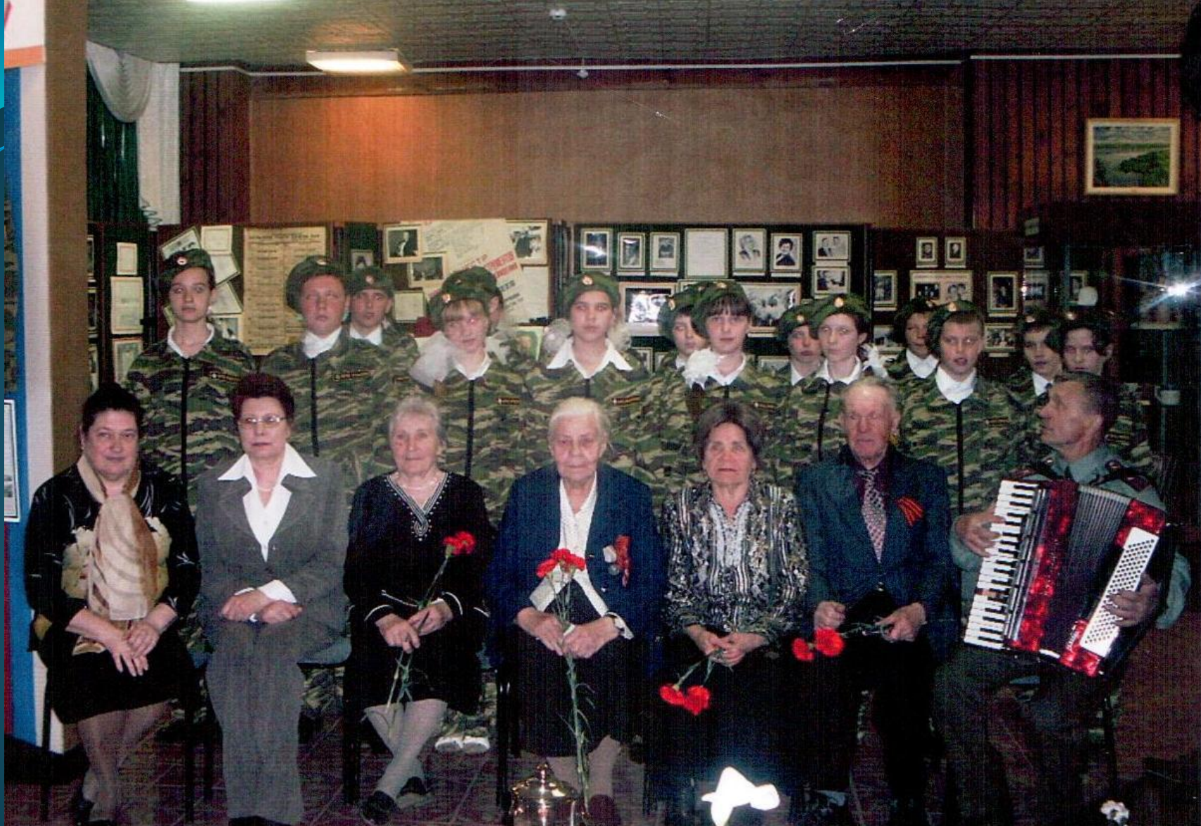
МЕРОПРИЯТИЕ «ДЕТИ ВОЙНЫ» В КОВЫЛКИНСКОМ МУЗЕЕ