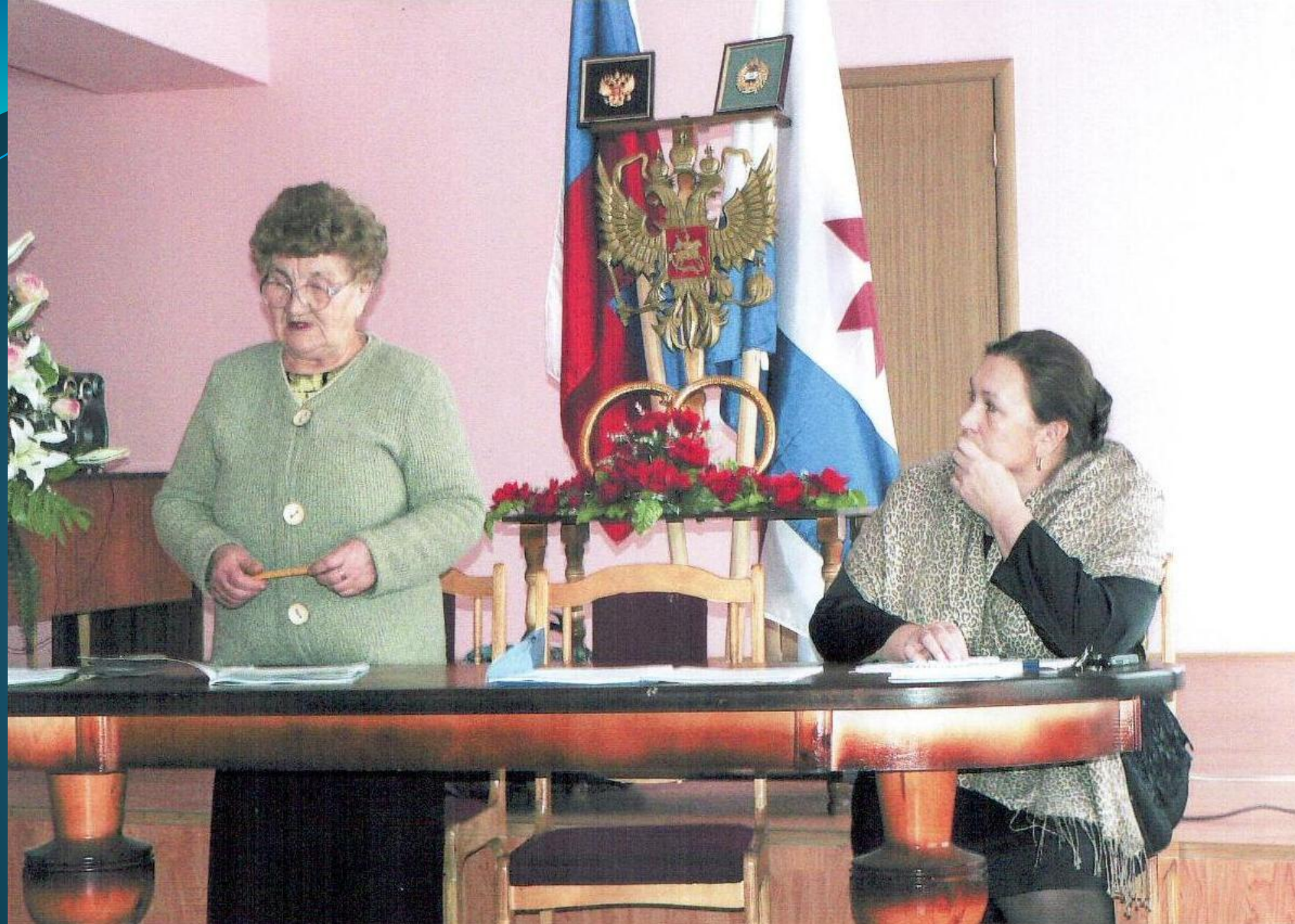
ЗАСЕДАНИЕ ТЕНЬГУШЕВСКОГО РАЙОННОГО СОВЕТА ВETERАНОВ