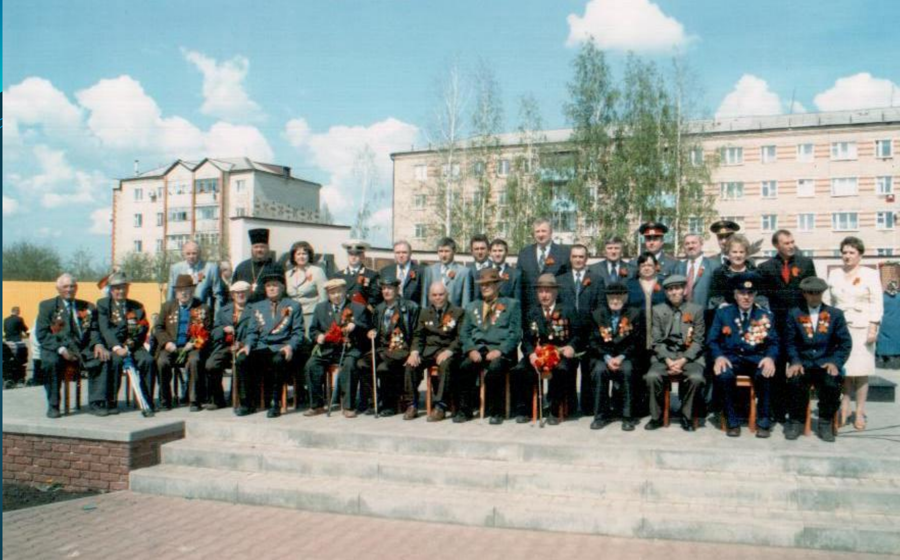
ВETERАНЫ ВЕЛИКОЙ ОТЕЧЕСТВЕННОЙ ВОЙНЫ. г. КРАСНОСЛОБОДСК. 9 мая 2010 г.