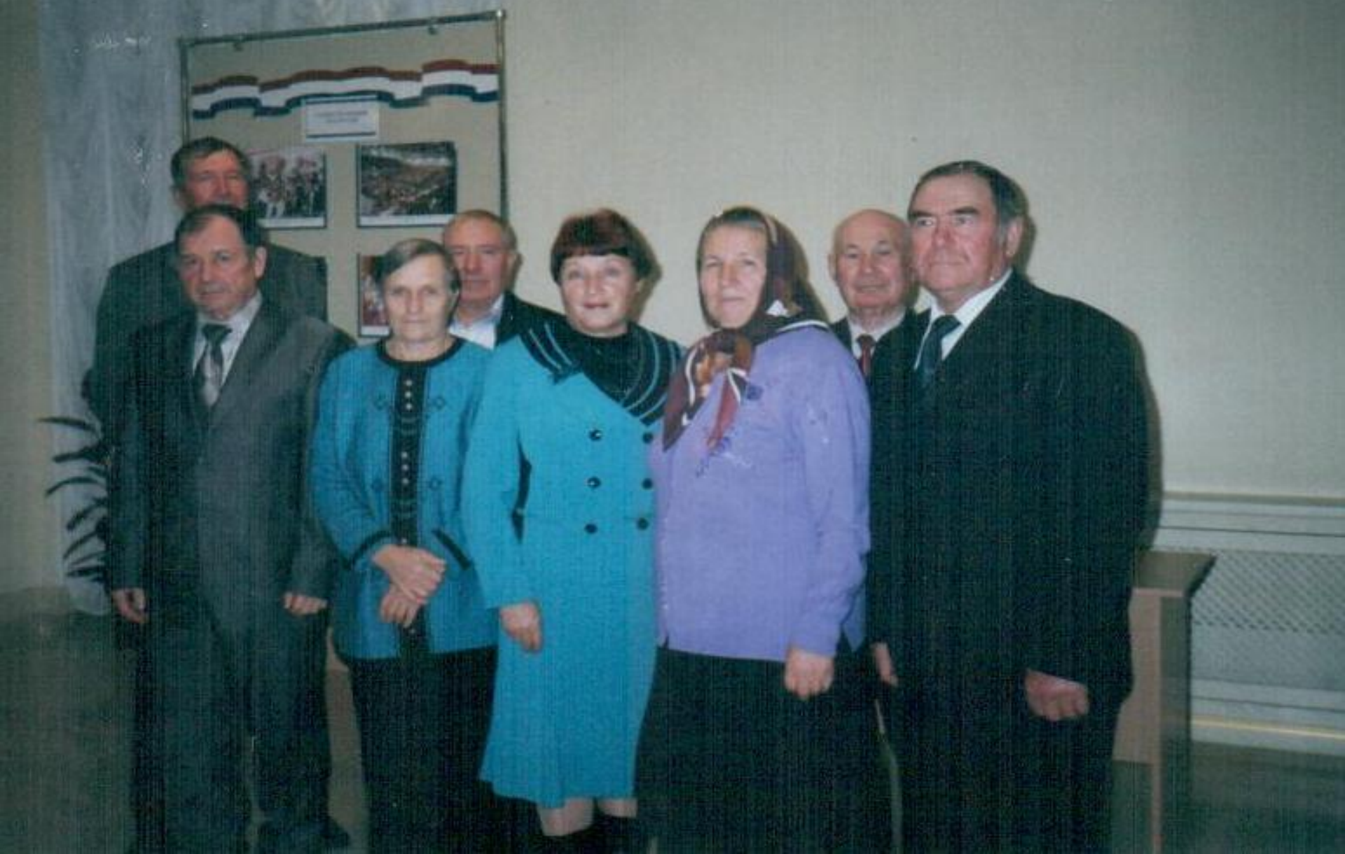
ВЕТЕРАНЫ АТЮРЬЕВСКОГО РАЙОНА