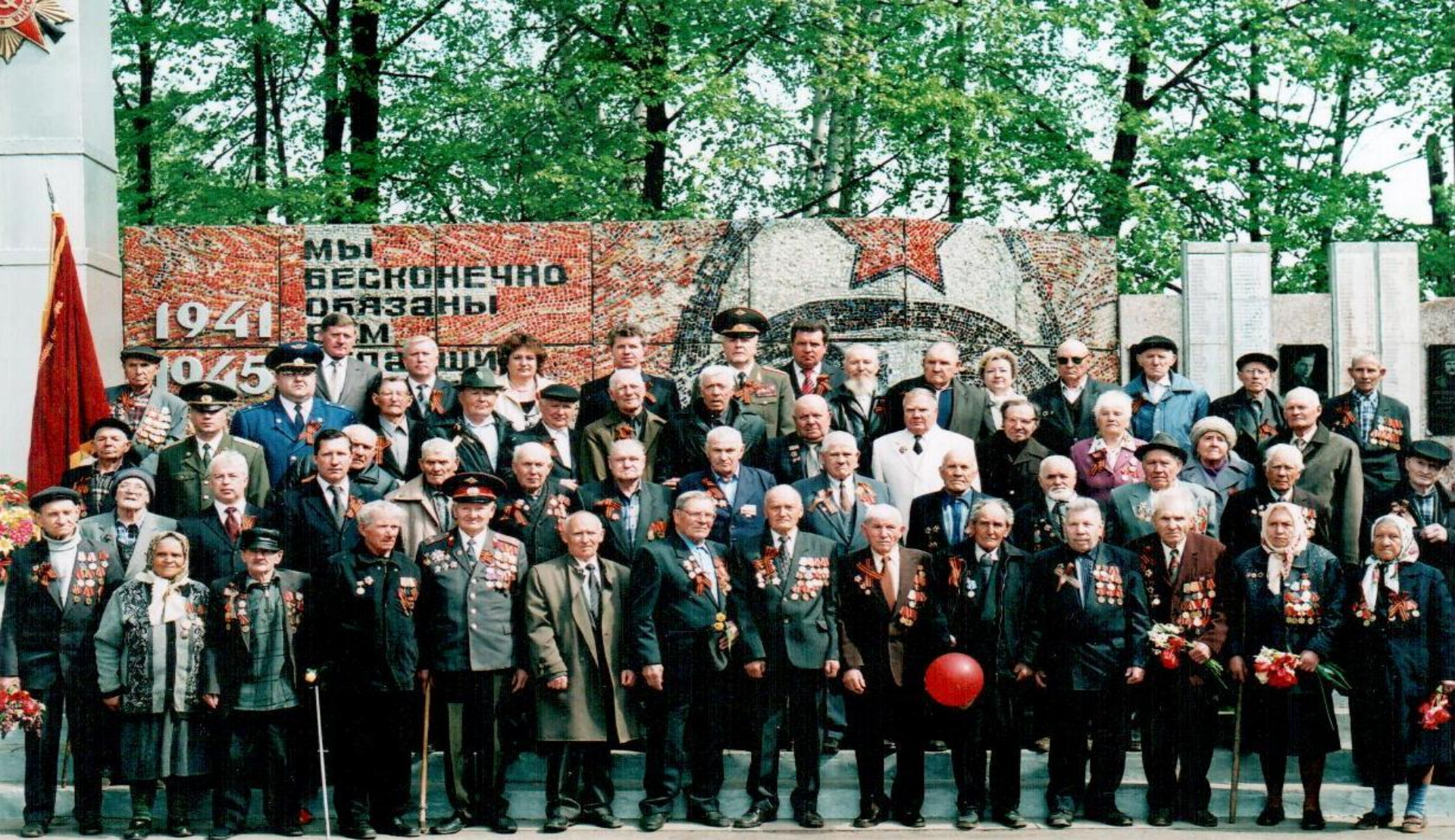
АРДАТОВСКИЙ РАЙОН: У ПАМЯТНИКА ПАВШИМ ВОИНАМ В ДЕНЬ ПОБЕДЫ. 2008 г.