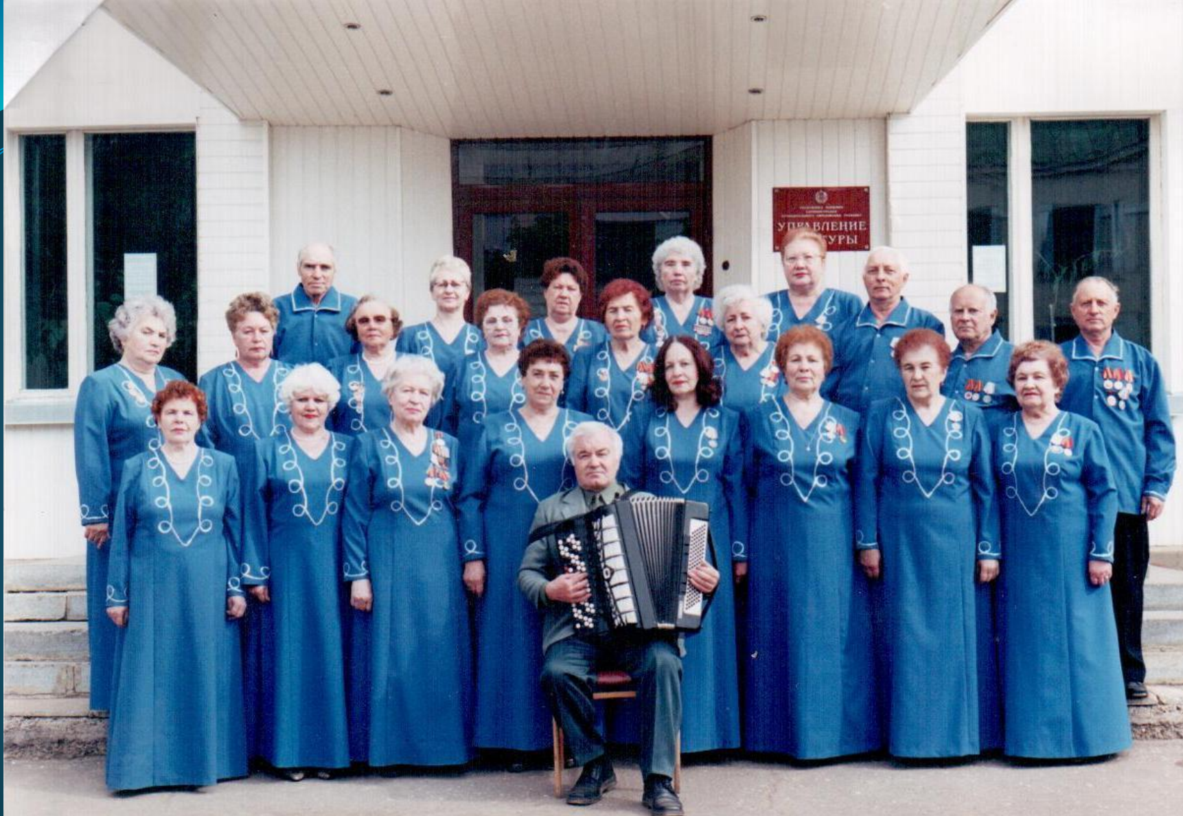
НАРОДНЫЙ ХОР ВЕТЕРАНОВ РУЗАЕВСКОГО РАЙОНА. КОНЦЕРТ В ЧЕСТЬ ПРАЗДНОВАНИЯ ДНЯ ПОБЕДЫ. 2004 г.