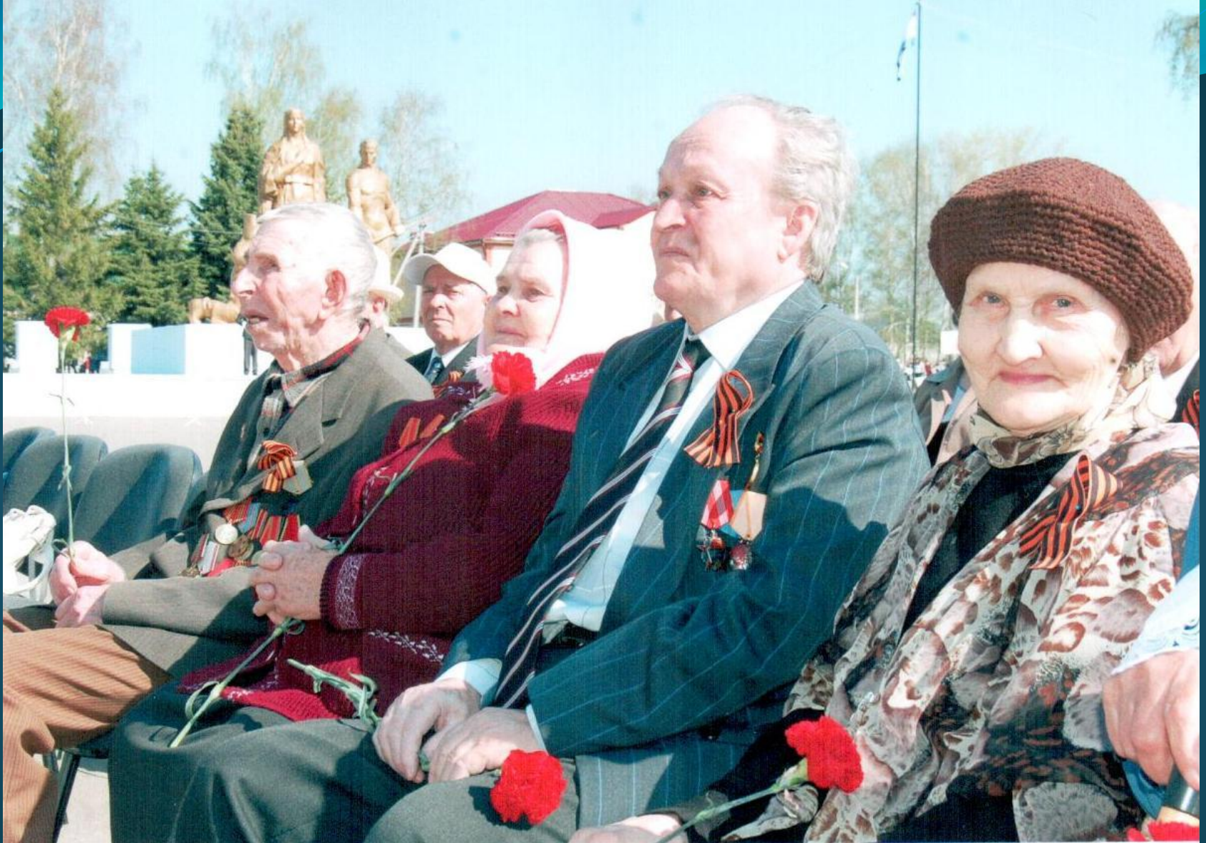
ВЕТЕРАНЫ АТЯШЕВСКОГО РАЙОНА