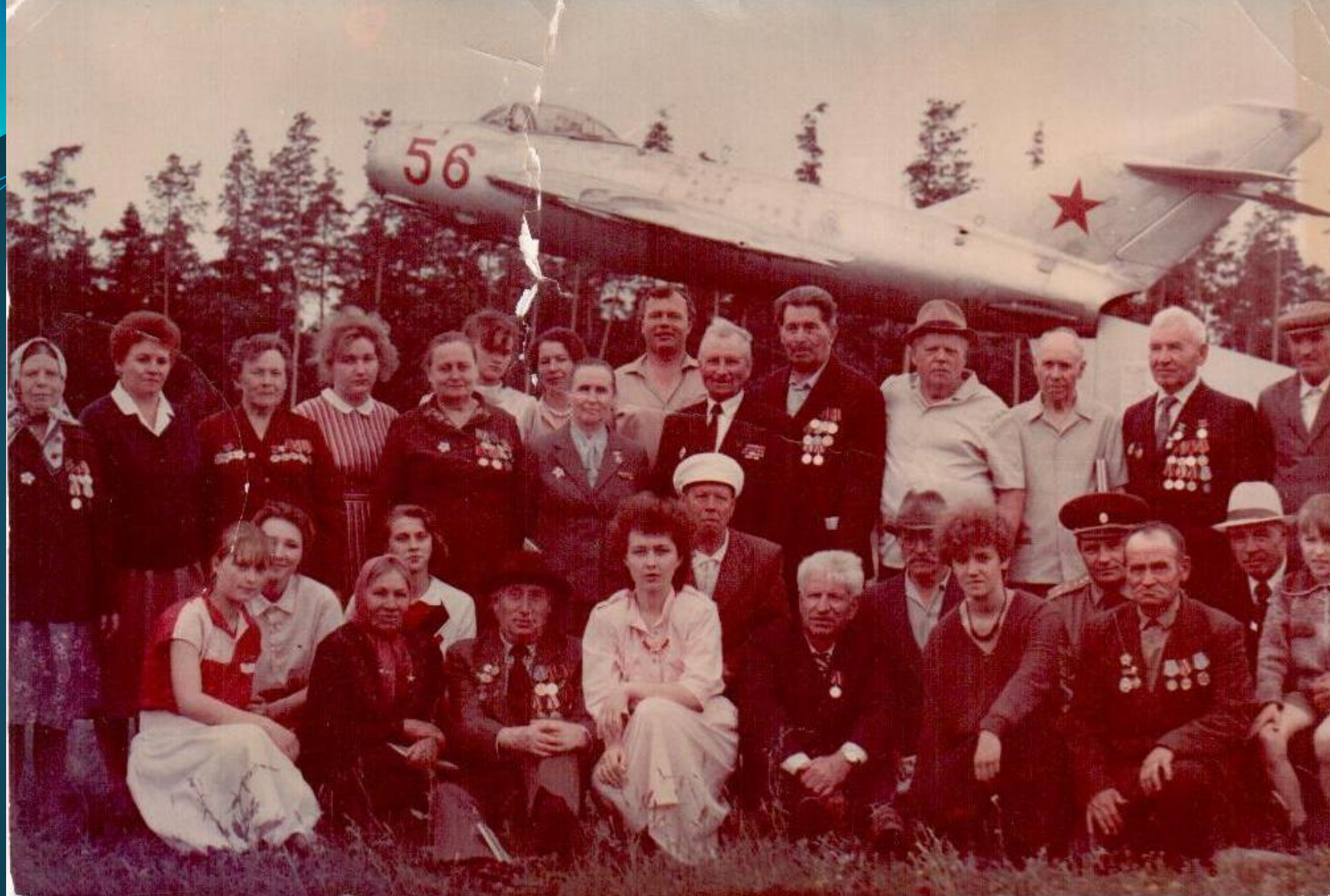
ВСТРЕЧА ВЕТЕРАНОВ ВЕЛИКОЙ ОТЕЧЕСТВЕННОЙ ВОЙНЫ ЧАМЗИНСКОГО РАЙОНА. 1988 г.