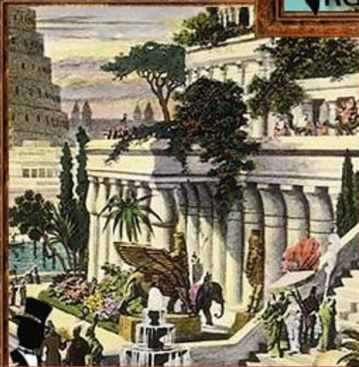
Висячие сады Семирамиды.