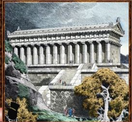
Храм Артемиды в Эфесе.