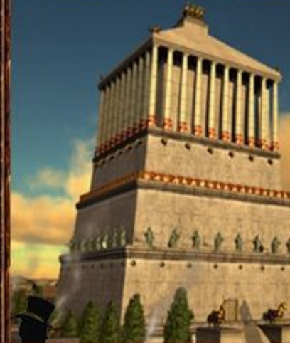
Мавзолей в Галикарнасе.