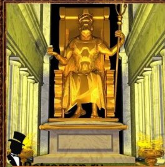
Статуя Зевса в Олимпии.