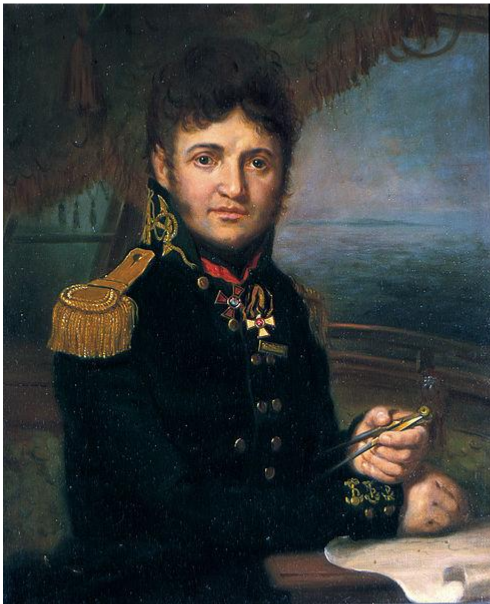
Лисянский Ю.Ф. Плавание на кораблях «Надежда» и «Нева».