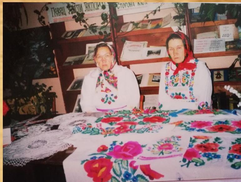
Фото нач.2002 г.

После библиотеки работала в Чкаринском детском саду.