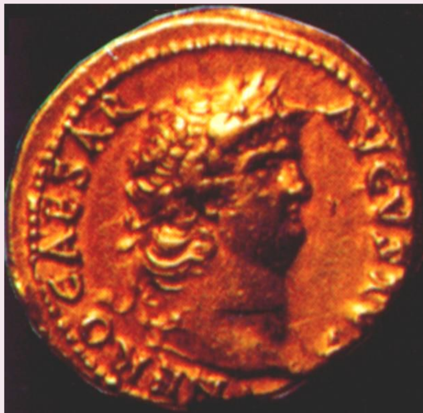
Древнеримская монета с изображением Нерона

Самой зловещей фигурой среди императоров 1-го века н.э. был Нерон.