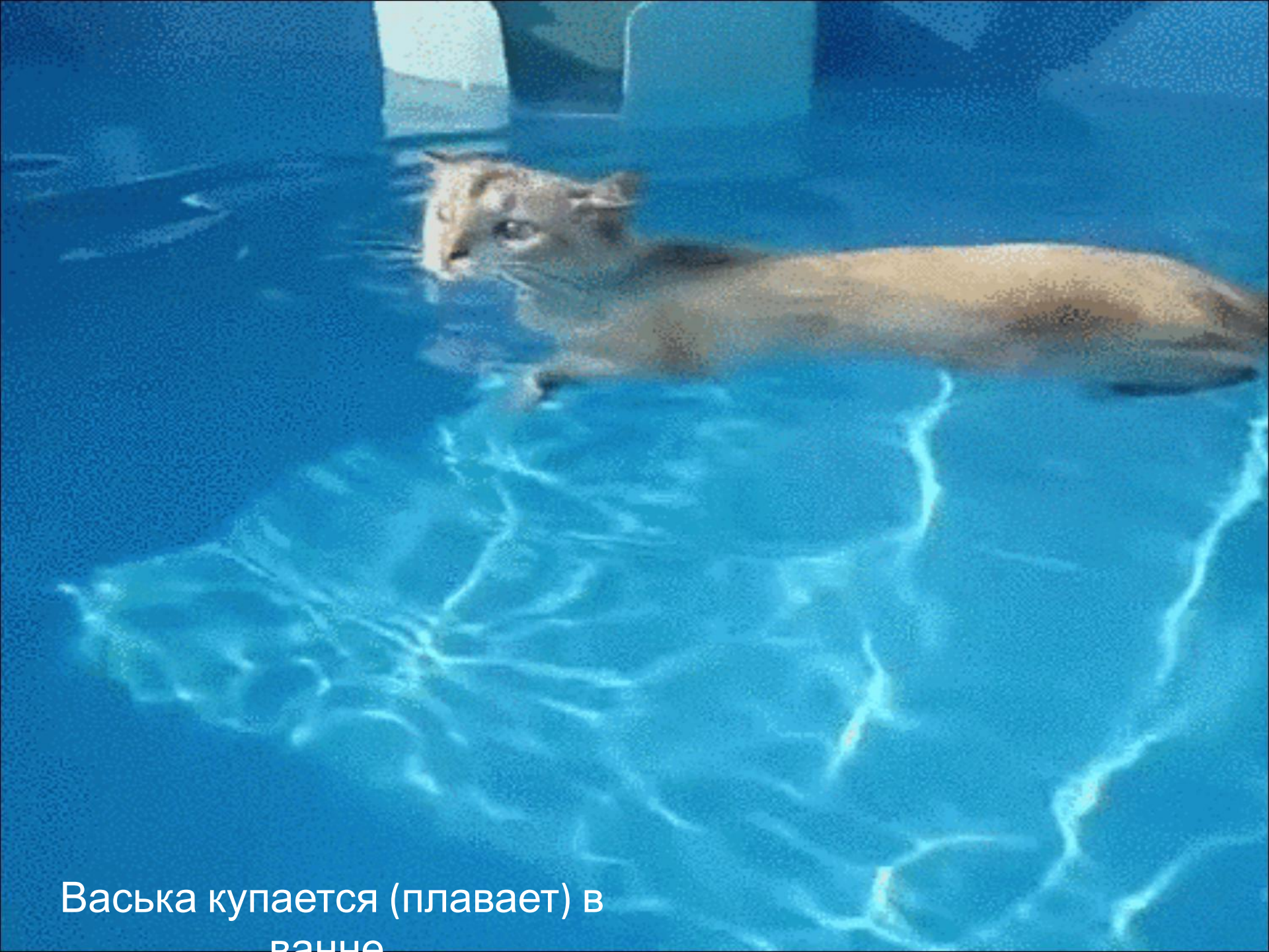
Васька купается (плавает) в ванне