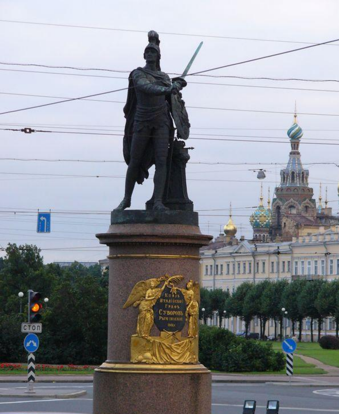
Памятник Александрю Васильевичу Суворову