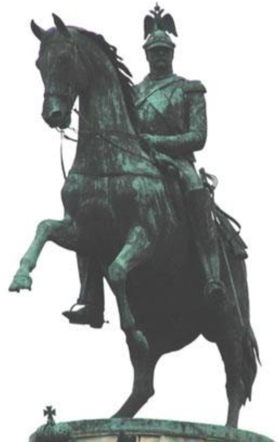
Памятник Николаю I в Санкт-Петербурге

Главным направлением внутренней политики Николая I стало укрепление положения дворянства и борьба против революционной угрозы. Даже разработка проектов реформ осуществлялась исключительно в этих целях. Период правления Николая I называют «Апогей самодержавия» , то есть время наиболее полного проявления абсолютизма, неограниченной власти монарха во всех сферах жизни России.