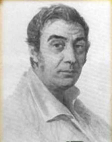
Архитектор А. Кавос Автопортрет

Он назван в честь Марии Александровны, жены царя Александра II. Здание театра построил архитектор Альберт Кавос.