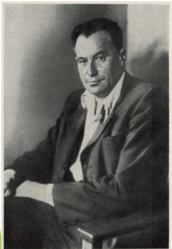
В. П. Катаев, 1947 г.