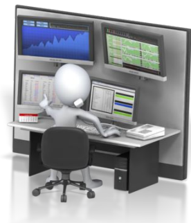
Размещение активов в инвестиционных компаниях-партнерах