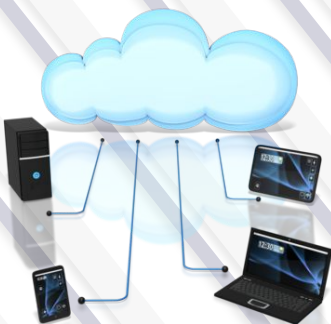
Мобильный сервис и трафик данных IT технологии