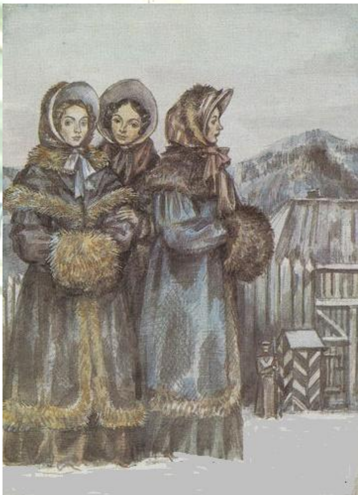
Поэма Н.А. Некрасова «Русские женщины»

Но не только крестьянки - предмет любования поэта. Все героини Некрасова - женщины самоотверженные, способные принести себя в жертву тем, кого они любят.