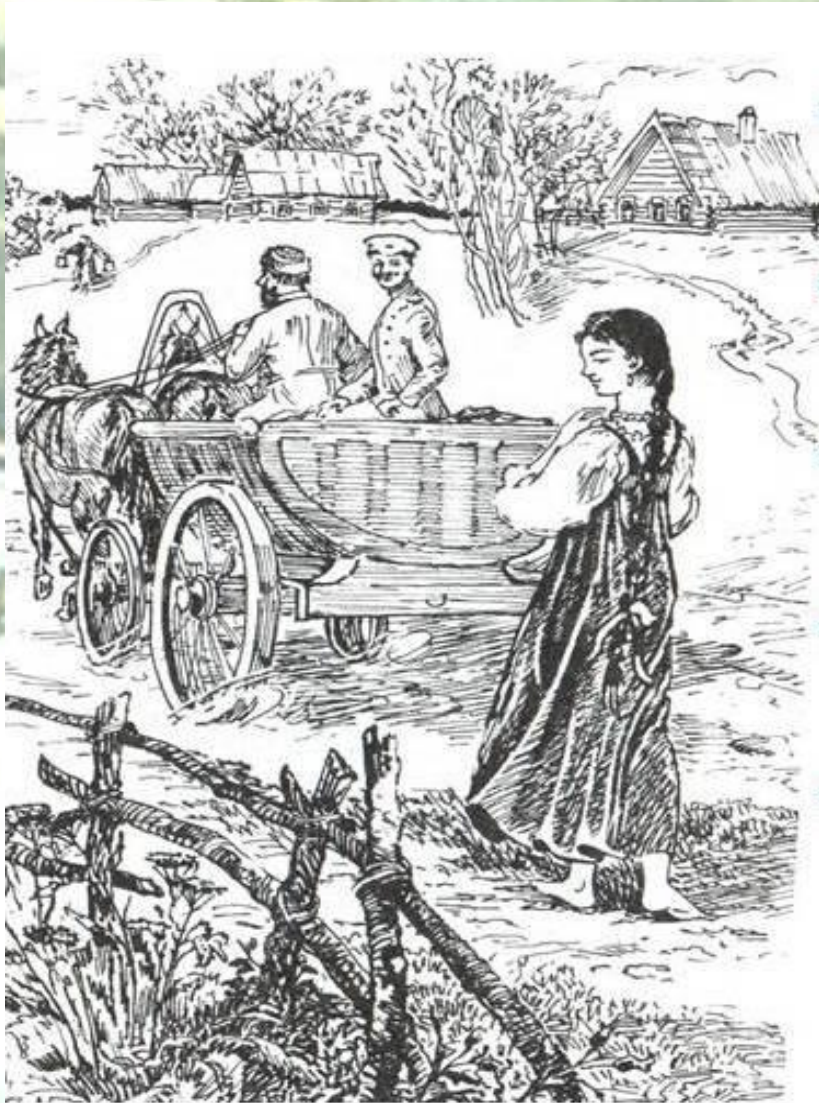
Стихотворение «Тройка» Н.А. Некрасов

В стихотворении «Тройка» Некрасов обращается к молодой девушке, у которой впереди еще целая жизнь. Она полна озорства и веселья, ей не чужды девичьи игривые мечты. Она еще не знает, что ждет ее впереди. Некрасов предрекает ей жалкое и убогое существование. Ни красота, ни веселый нрав не помогут ей избежать тяжелой женской доли: