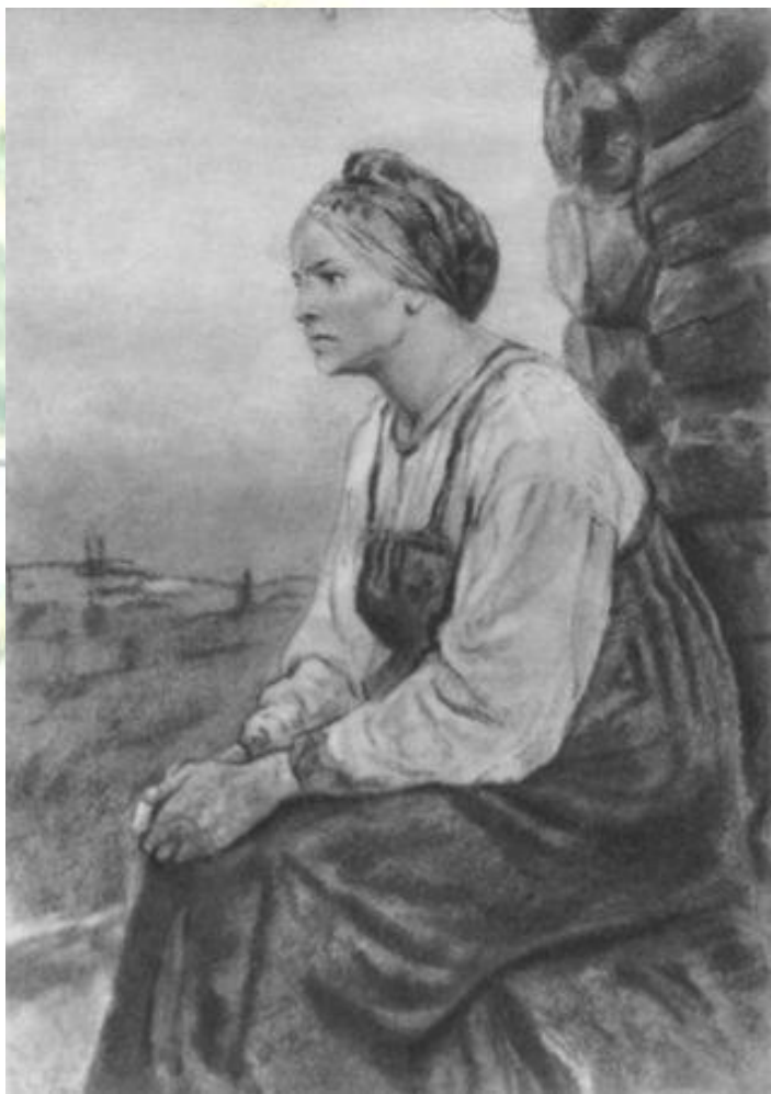
Поэма Н.А. Некрасова «Кому на Руси жить хорошо»

Наиболее полно тип женщины крестьянки раскрыт в поэме «Кому на Руси жить хорошо» в образе Матрены Тимофеевны Корчагиной.