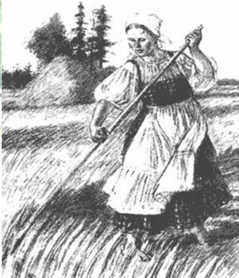
Стихотворение Н.А. Некрасова «Мороз, Красный нос»

Русская женщина предстает в стихах Некрасова не только в образе замученной работой крестьянки. Есть и другой тип – величавой славянки.