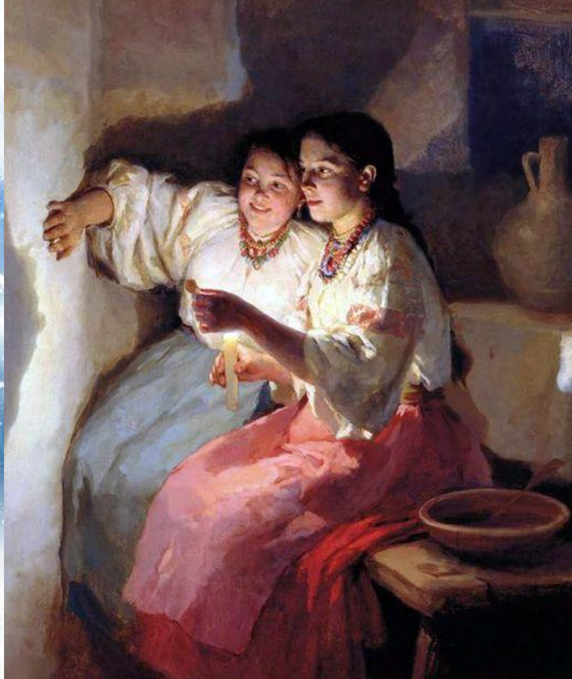
Николай Пимоненко «Святочное гадание»