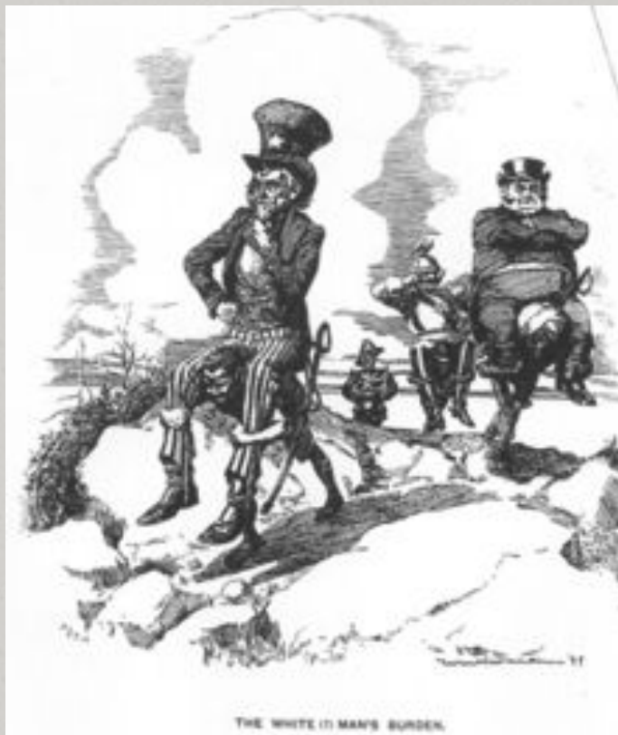
Карикатура, на тягар білої людини

Наскільки цілі, озвучені у вірші, відповідали реальній дійсності?