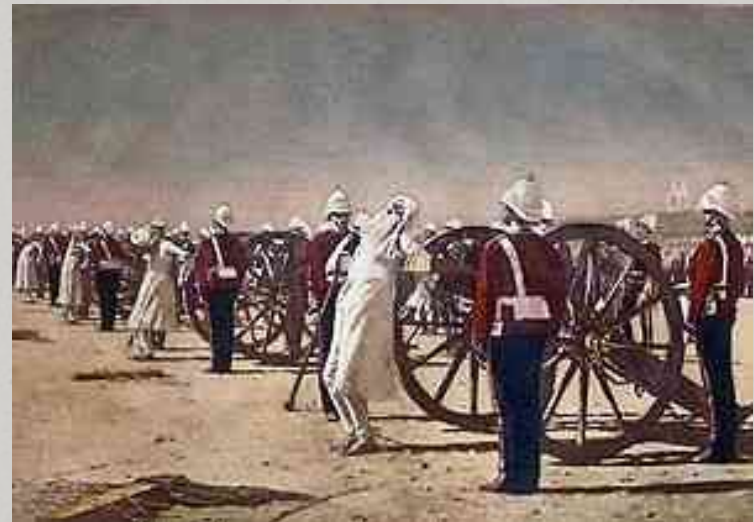
Картина В.Верещагина «Подавление индийского восстания англичанами», 1884

Чому англійці розправилися з сипаями з такою жорстокістю ?