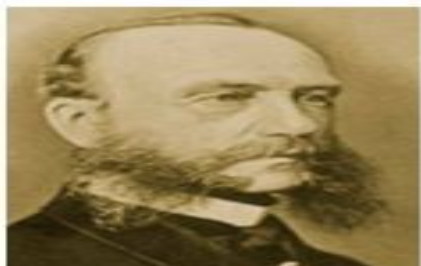
В.Гризингер (1845) психикалық аурулар бұл мидың ауруы.