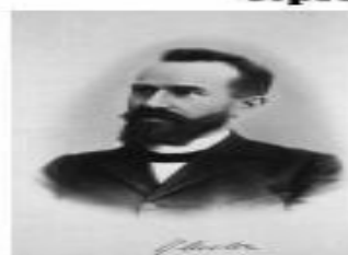
Е.Блейлер (1911): шизофрения ; DATA LIFE ENGINE SOFTWARES MEDIA GROUP

Karl Ludwig Kahlbaum, ca 1890, Public Domain in countries where copyright term is life of author plus 70 years.