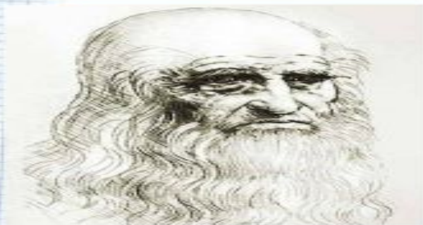
Леонардо да Винчи

Леонардо Да Винчи ми анатомиясын және Микеланжело екеуі психикалық науқастардың мимикаларын суреттейді.