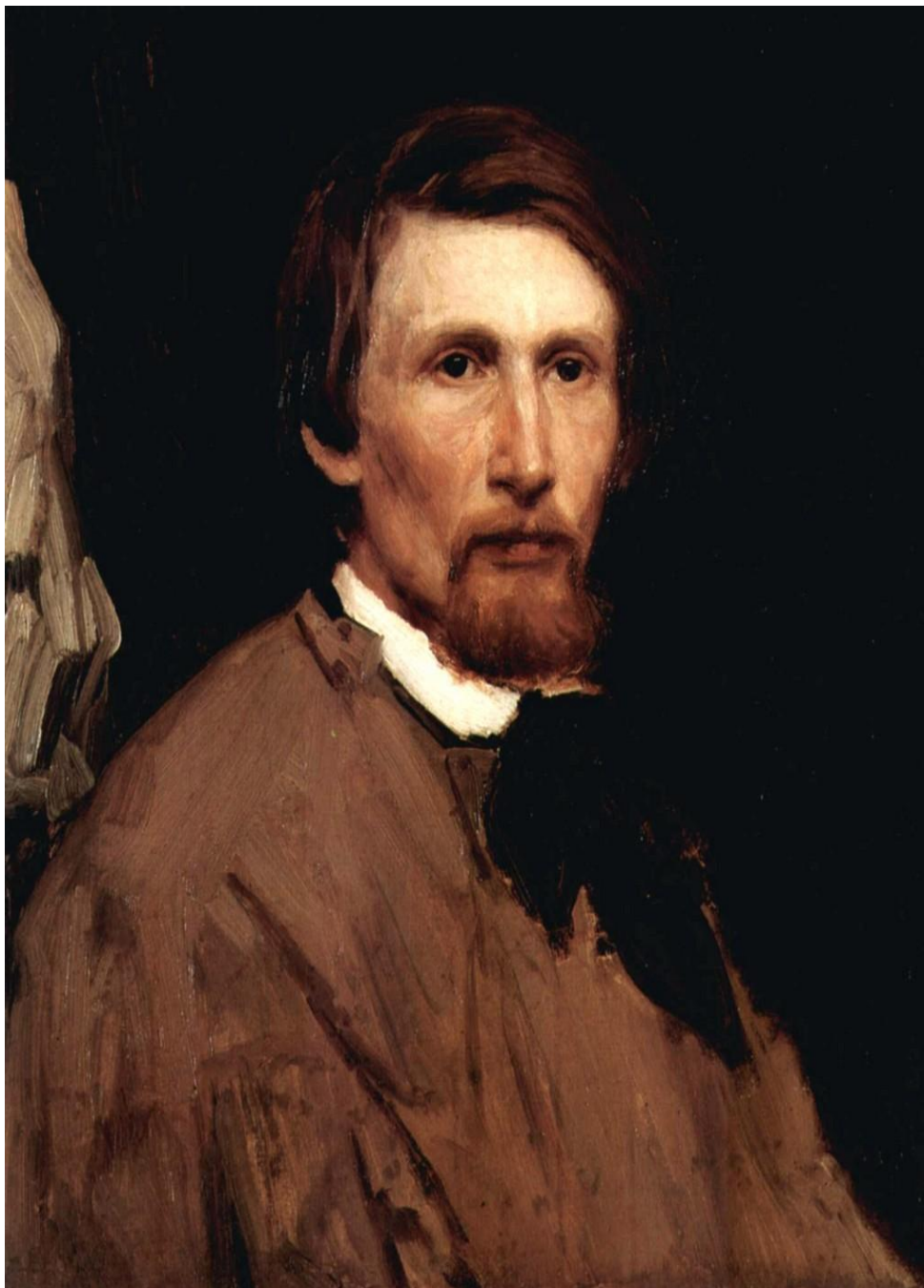
Виктор Михайлович Васнецов (1848 – 1926)