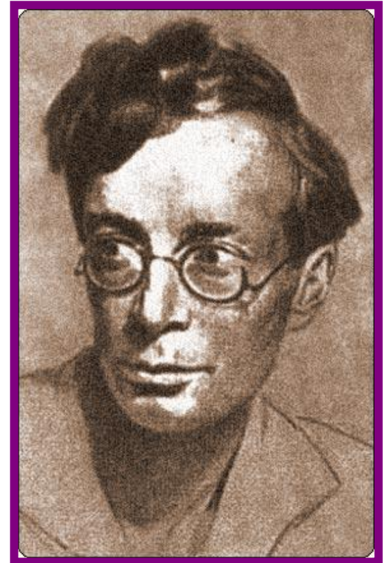
Дмитрий Борисович Кедрин (1907-1945)