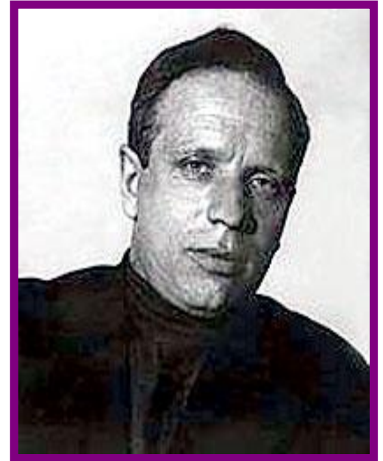
Александр Андреевич Прокофьев (1900-1971)

Пруд заглохший весь в зеленой ряске, В ней тростник качается, шумит А на берегу, совсем, как в сказке, Милая Аленушка сидит. Прост веноч, а нет его красивей, Красен от гвоздик, от лилий бел. Тополиный на платье синем, С тополиных роц он прилетел. С берега трава, врываясь буйно, Знать не хочет, что мертва вода, И цветет дурман цветком багульник Рядом у заглохшего пруда Но кукушка на сосне кукует, И тропинка к берегу ведет, Солнце щедро на воду такую Золотые обручи кладет.