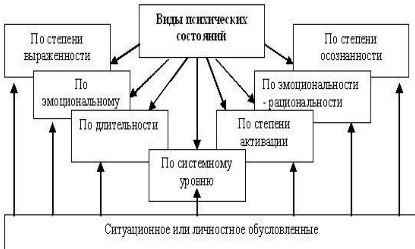
Рис. 14.1 Виды психических состояний