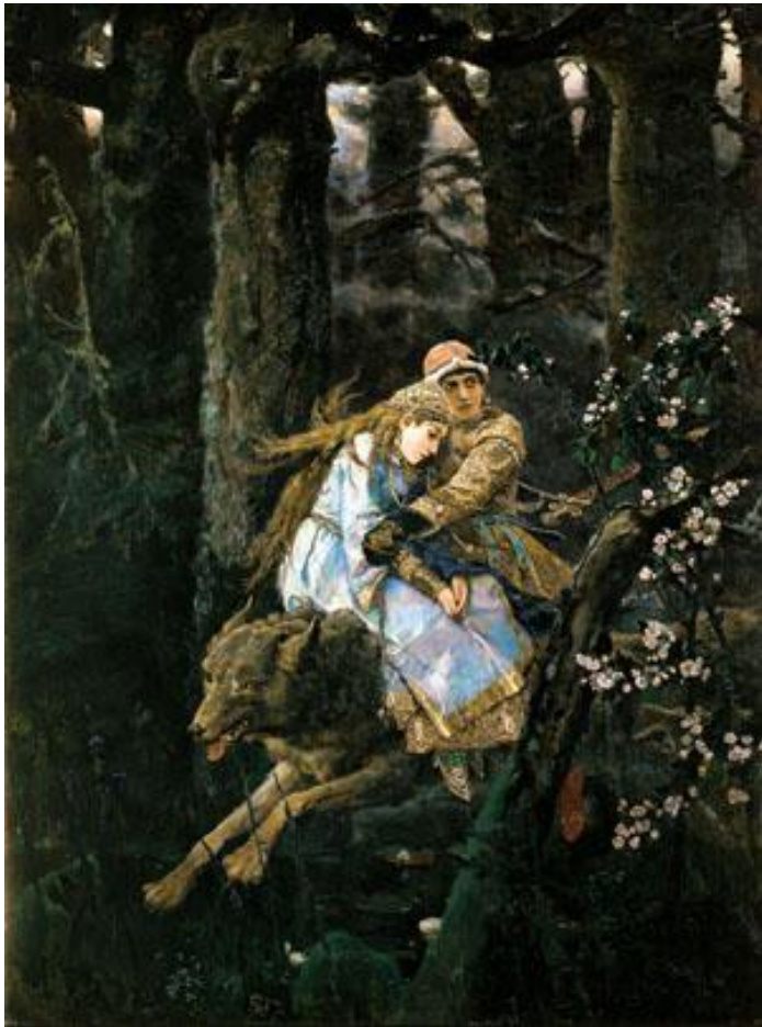
В.Васнецов «Иван Царевич на Сером волке»

Сказочно-мифологический - жанр изобразительного искусства, герои которого персонажи былин, мифов, сказок