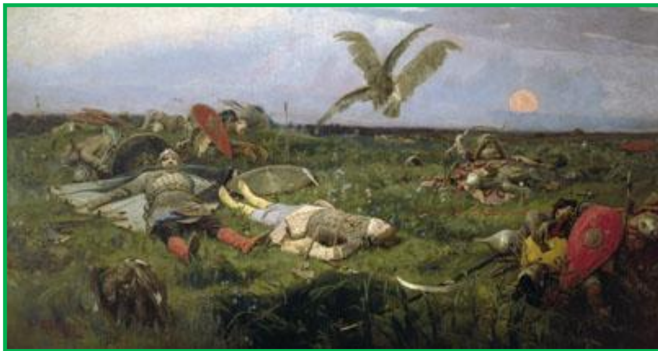
• В.Васнецов «После побоища Игоря Святославовича с половцами».

Батальный жанр (от фр. bataille — битва) — жанр изобразительного искусства, посвященный темам войны и военной жизни. В произведениях батального жанра главное место занимают сцены сражений и военных походов современности или прошлого. Формирование батального жанра началось в XVI веке, однако изображения битв известны в искусстве с древнейших времен.