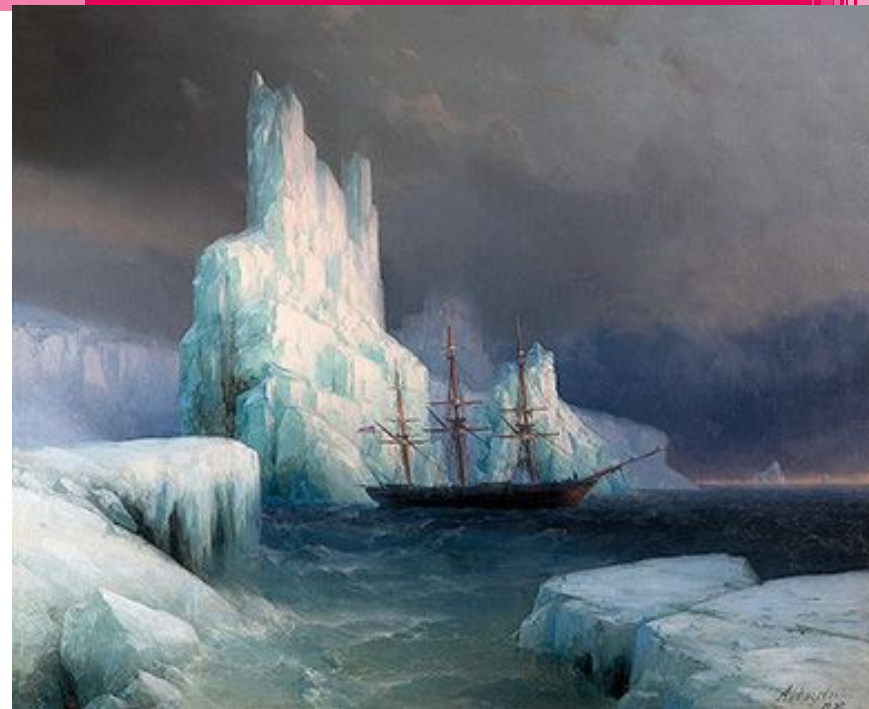
АЙВАЗОВСКИЙ ИВАН КОНСТАНТИНОВИЧ, «Ледяные горы в Антарктиде» 1870 год