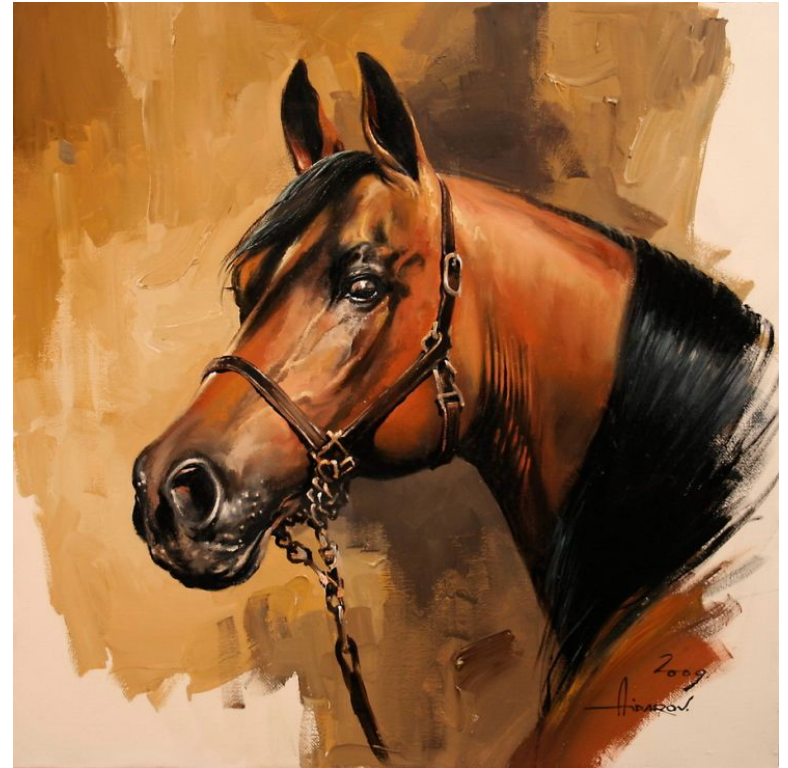
Художник ИЛЬЯС АЙДАРОВ, ПОРТРЕТ ЛОШАДИ.

Иппический жанр от греч. Hippos - лошадь - вид изобразительного искусства, в котором главным мотивом является изображение лошади. Особого расцвета искусство изображения лошадей достигло в XVIII и в XIX веках, когда наряду с жанровыми и батальными произведениями, включающими обобщенные изображения лошадей, художники-анималисты стали создавать портреты знаменитых скакунов и рысаков, достигая документального сходства. Исторической родиной «конского портрета» по праву считается Великобритания.