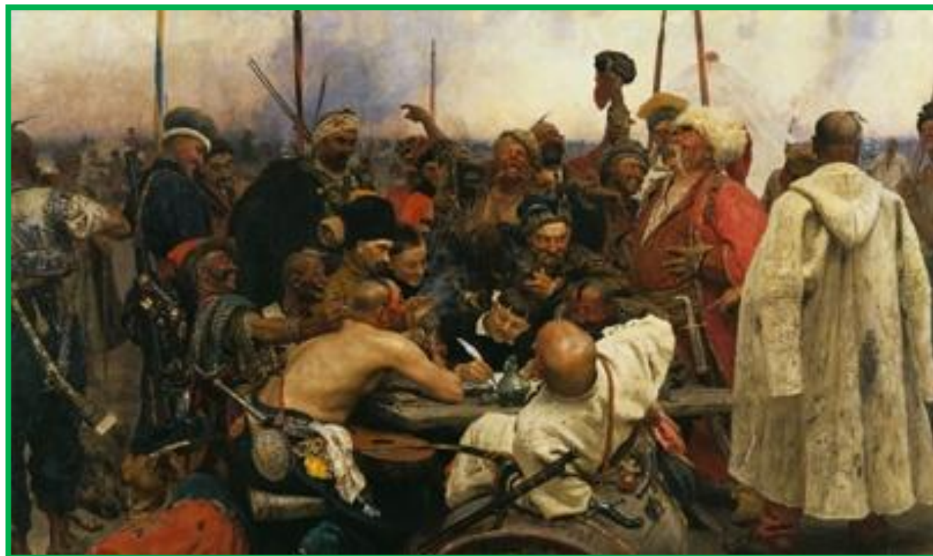
И.Репин «Запорожцы пишут письмо турецкому султану»

Исторический жанр - жанр изобразительного искусства, посвященный воссозданию событий прошлого и современности, имеющих историческое значение. посвященный историческим событиям и деятелям, а также социально значимым явлениям в истории общества.