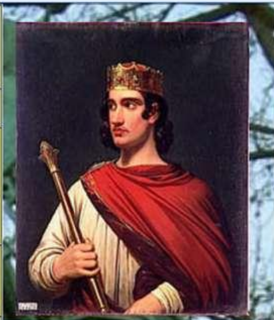
Лотарь – старший сын Карла Великого