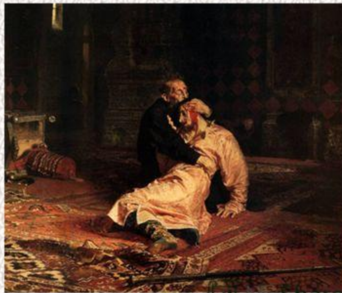
И.Е. Репин. Иван Грозный убивает своего сына.

Однако это не доказано. По другой версии Иван умер от болезни. А недавнее вскрытие останков показало, что возможно он был отравлен врагами Ивана Грозного.