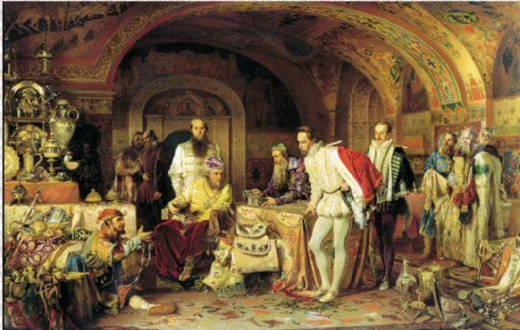
Литовченко А.Д. «Иван Грозный показывает сокровища английскому послу Горсею»