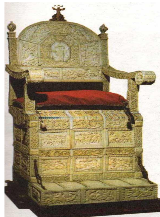
Трон Ивана Грозного