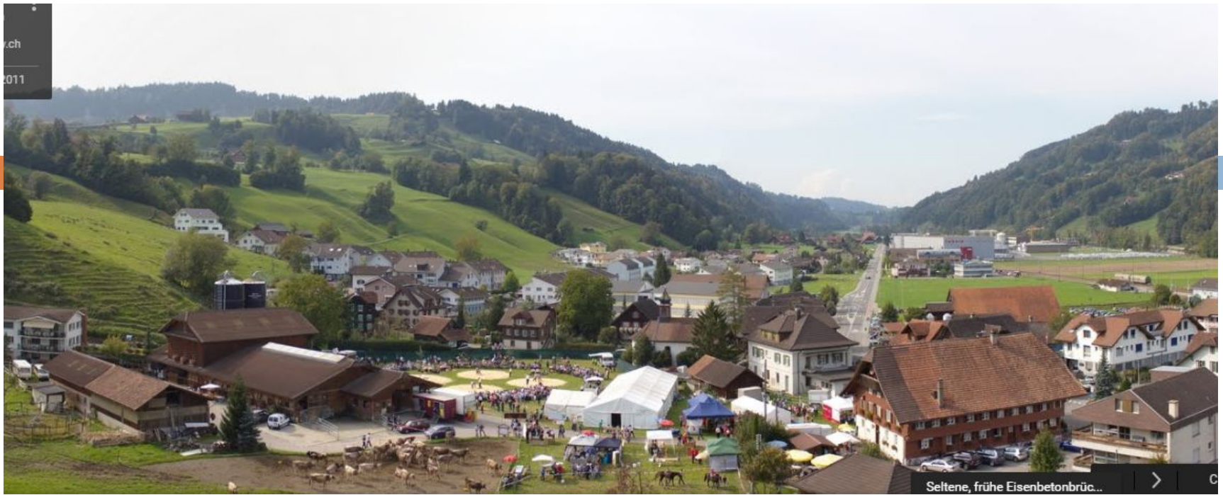
Seltene, frühe Eisenbetonbrüc...