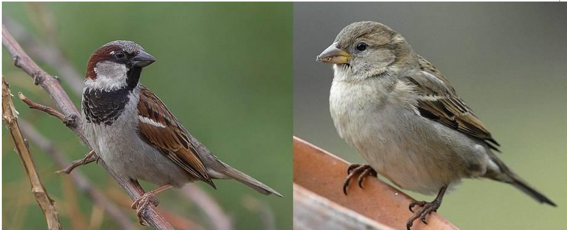
Самец воробья слева, самка воробья справа

Самца воробья от самки можно отличить по характерному черному пятну, которое охватывает подбородок, горло и верхнюю часть грудки. Голова самца также имеет темно-серый цвет. Самка воробья меньше по размеру, голова и горло имеют серый цвет, а над глазами расположены серо-желтые полосы, очень бледные, практически незаметные