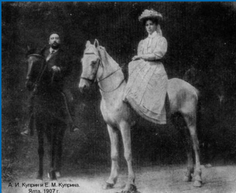
Елизавета Морицевна Куприна и А.И. Куприн Ялта 1907г.