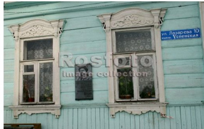
Музей имени А. И. Куприна