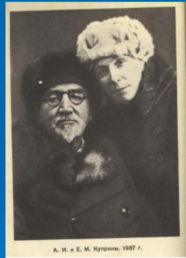
А.И. Куприн и Е.М. Куприна 1937 г.