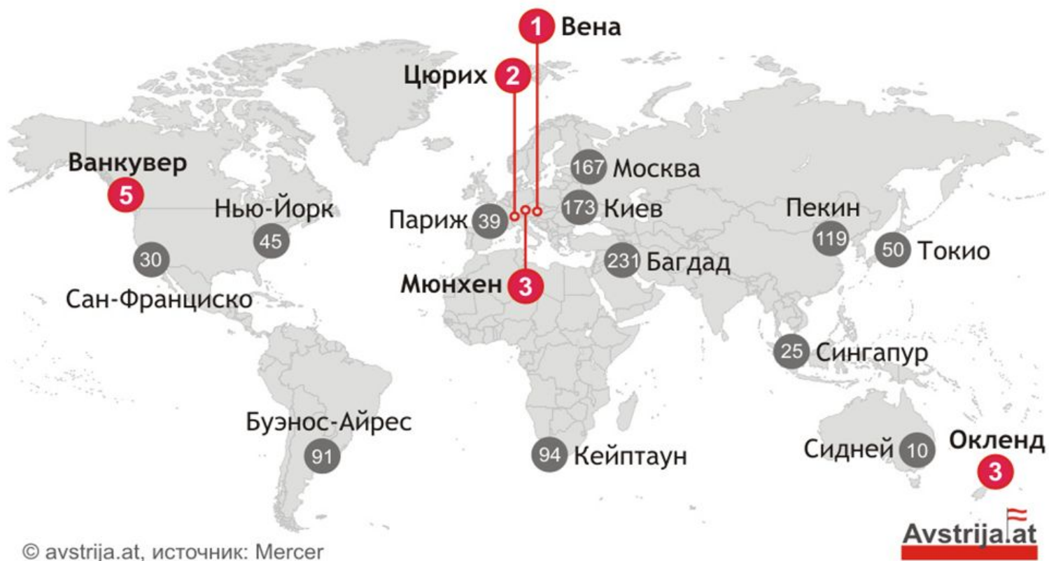
Рис.2. Самые комфортные города для проживания в мире [6]