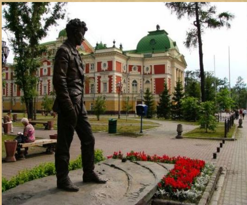
Памятник А. Вампилову в Иркутске