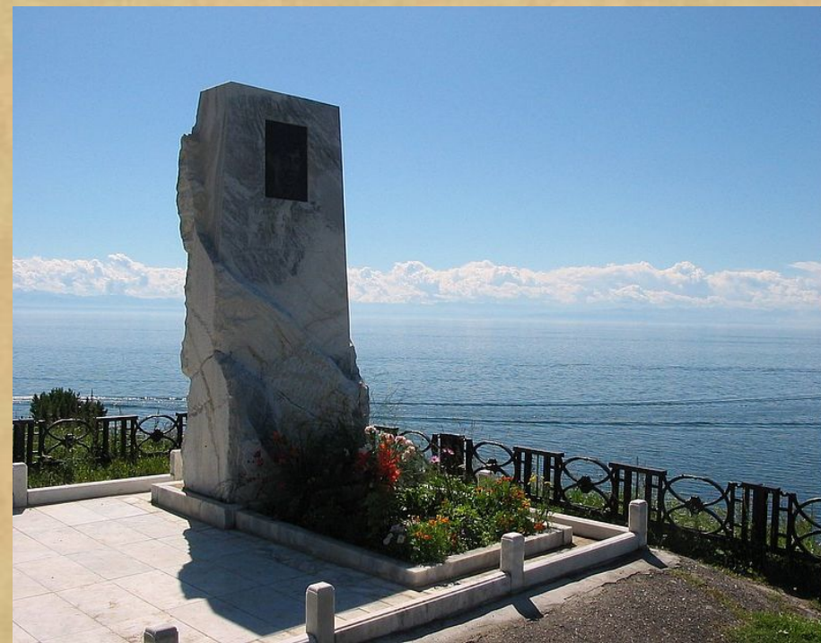
Мемориальный камень на месте гибели

Творчество Вампилова оборвала трагическая случайность. Вампилов утонул в озере Байкал 17 августа 1972.