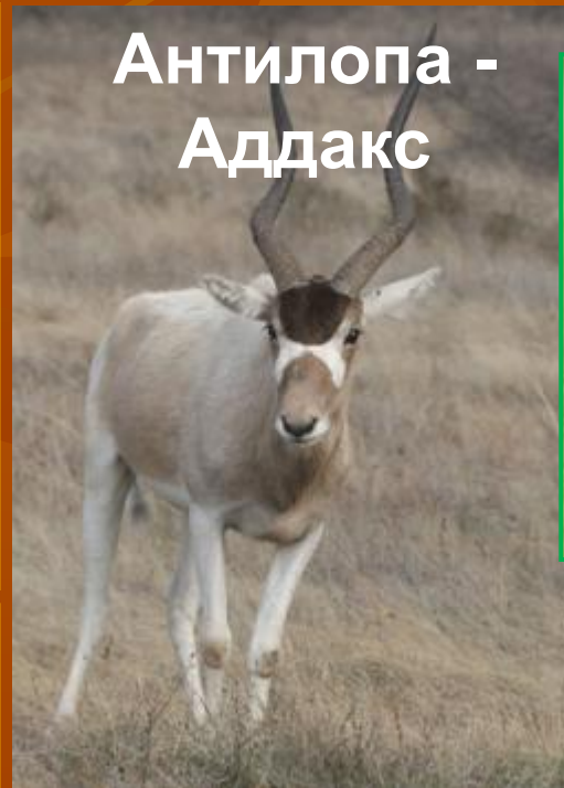
Антилопа - Аддакс