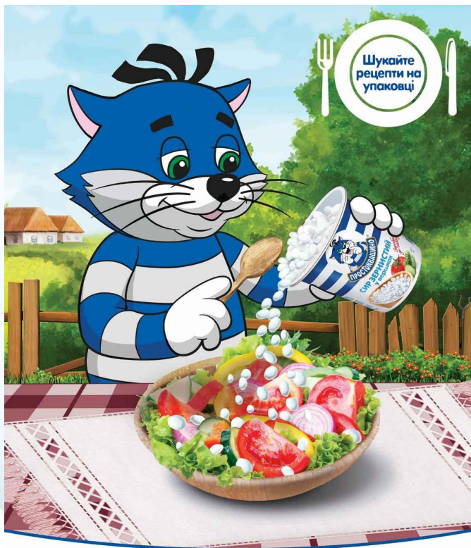
Весняний рецепт Матроскіна: сир Зернистий до салату

Рецепты блюд на основе Зернистого сыра Простоквашино