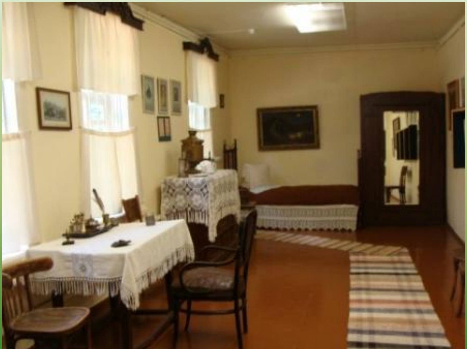
Комната земского учителя