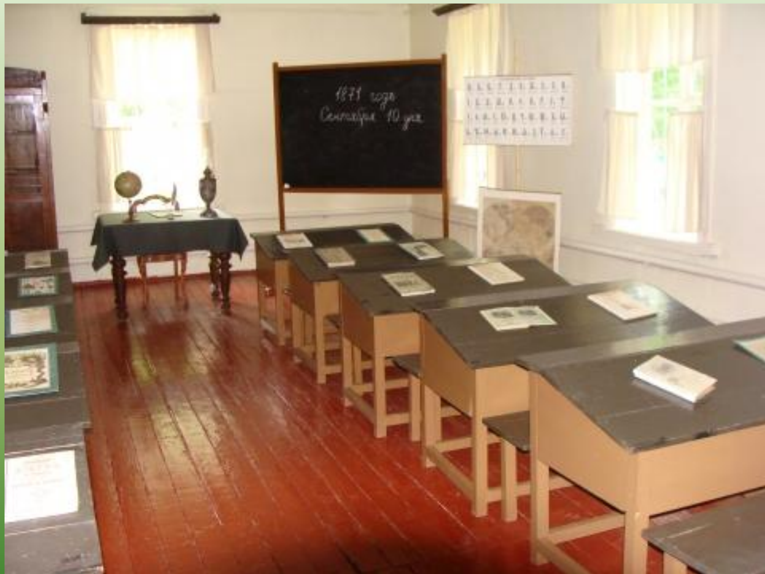
Класс с учебными пособиями XIX века