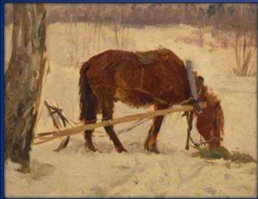
Пейзаж с лошадкой. (1957г.)