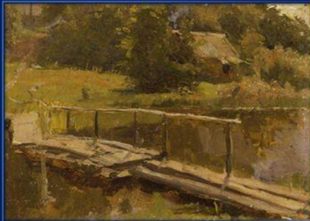
Мостик на речке. (1950г.)