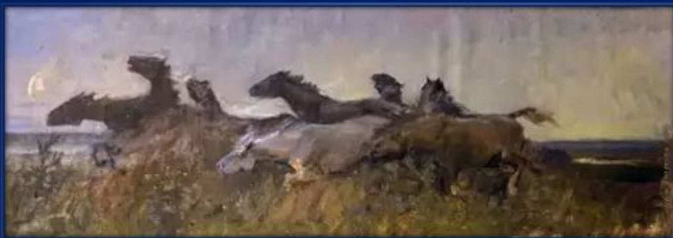
Горный Алтай. Табун. (1954г.)