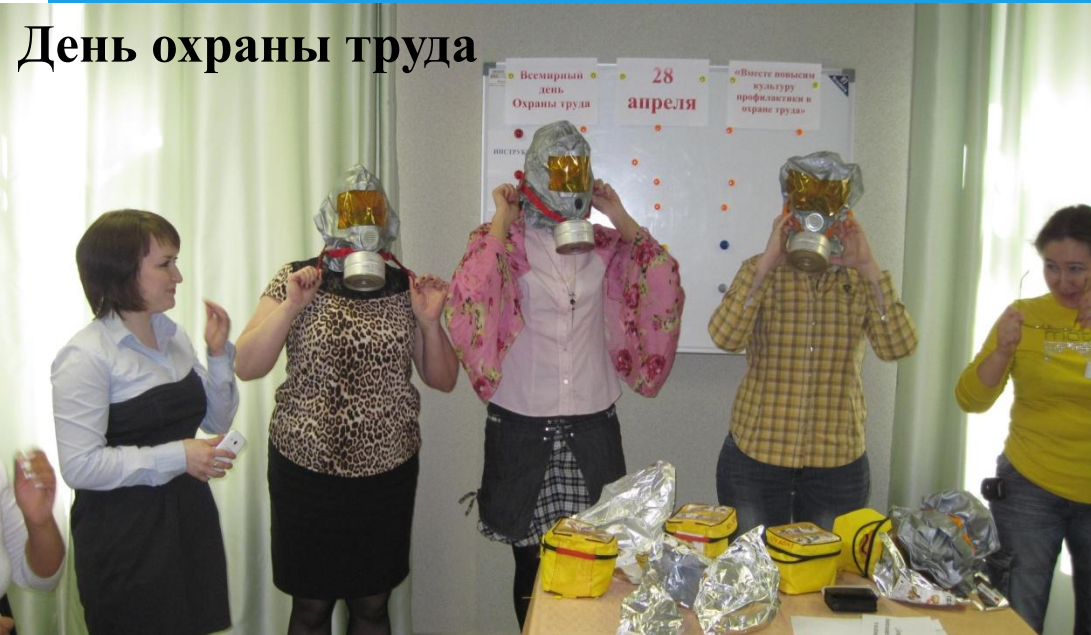
День охраны труда