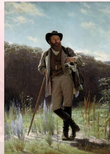
во весь рост