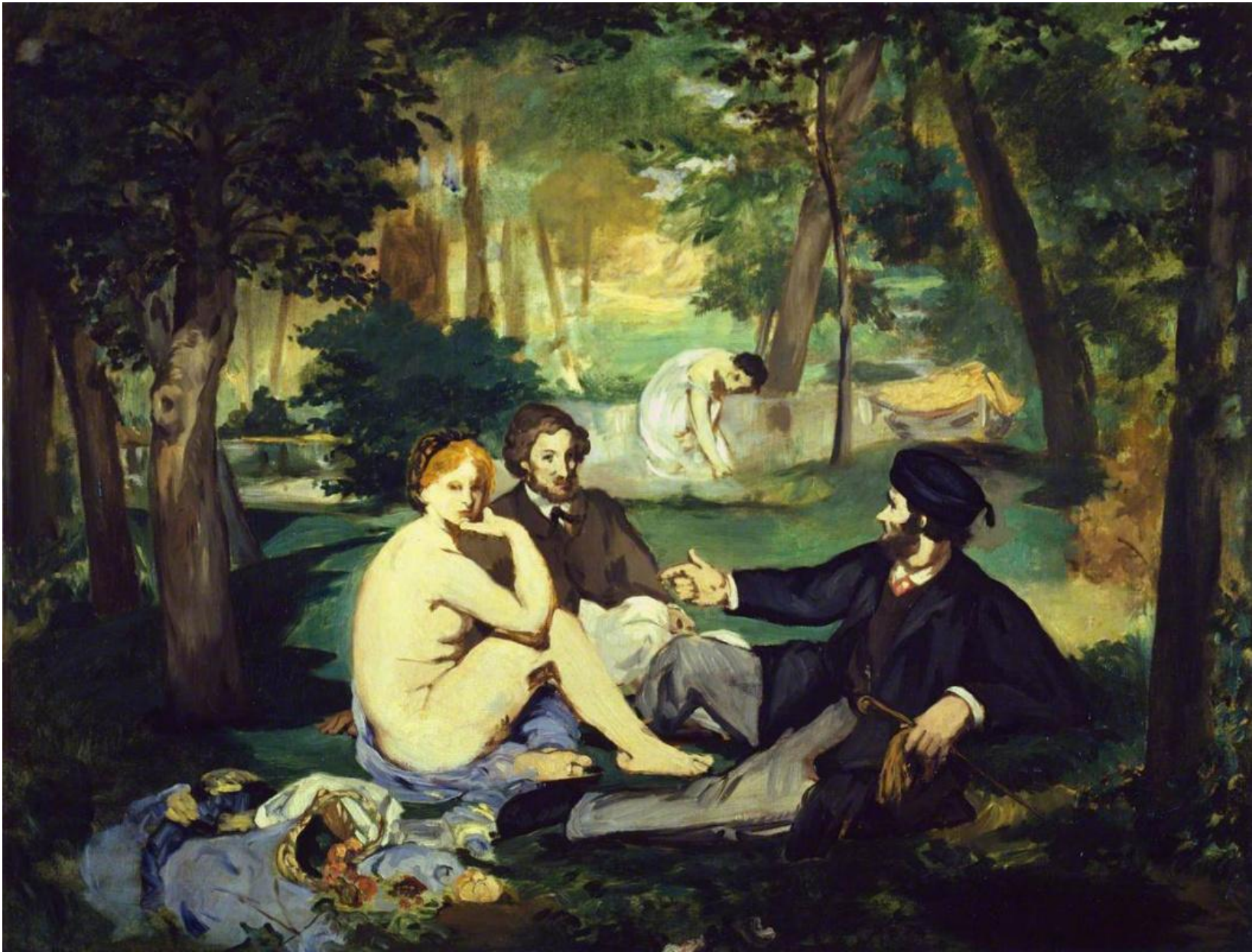
«Завтрак на траве», 1863 г.