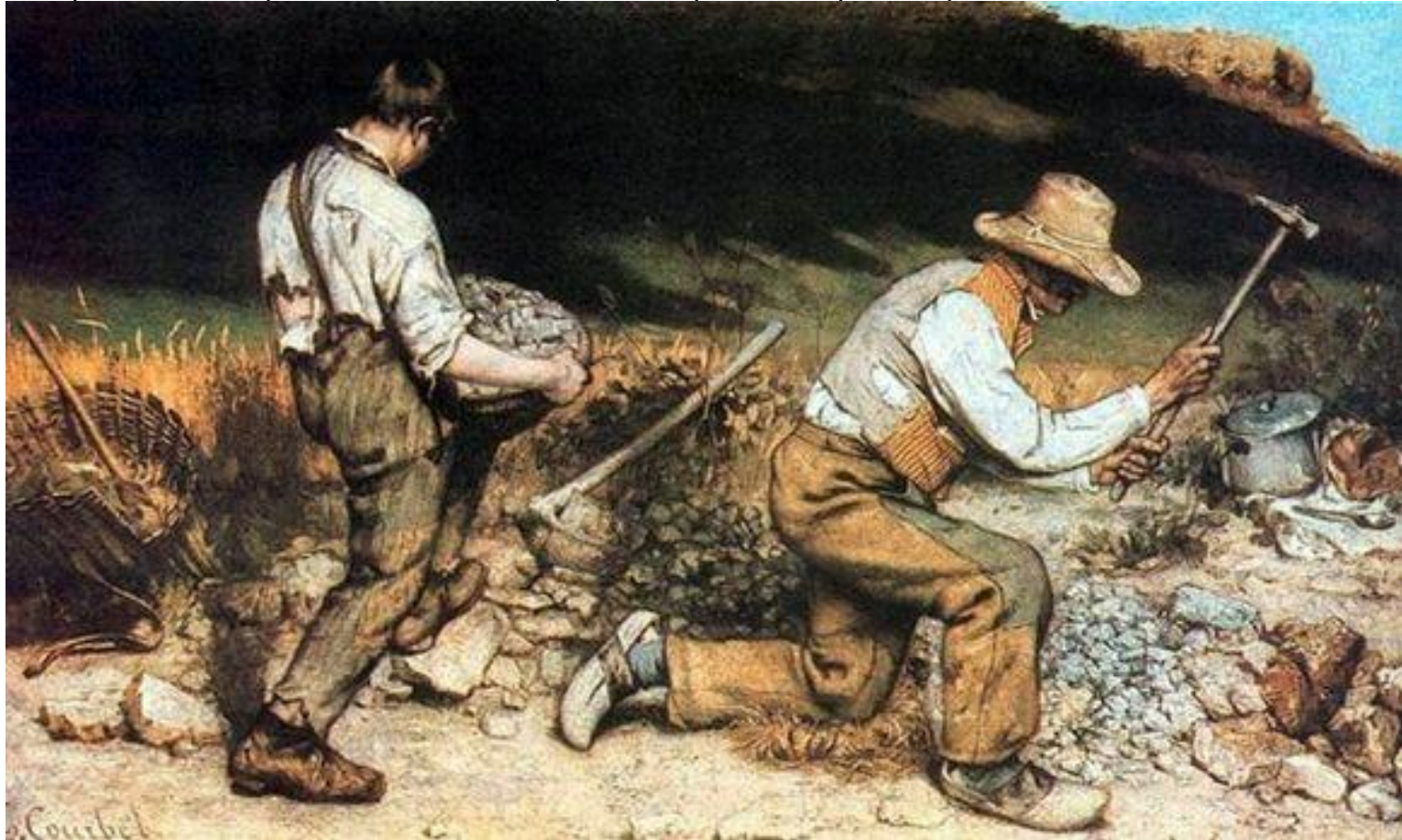
Дробильщики камней, 1848