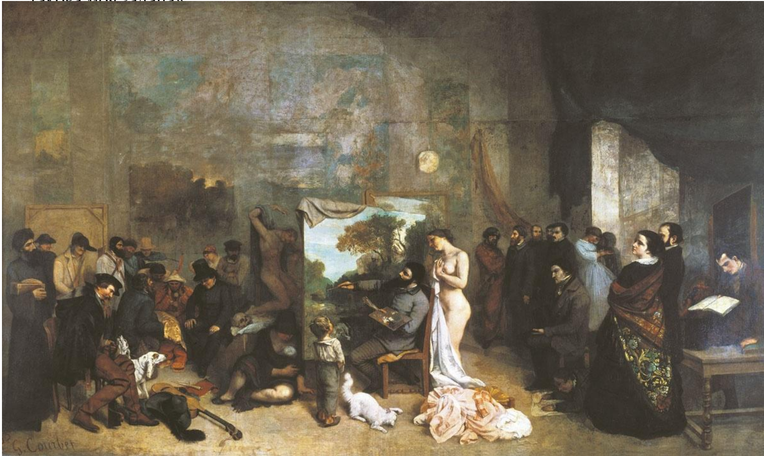
«Мастерская художника» (1855 г.).