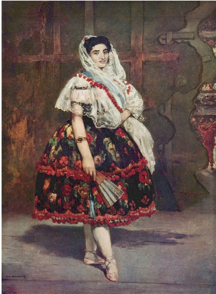
«Лола из Валенсии», 1862 г.