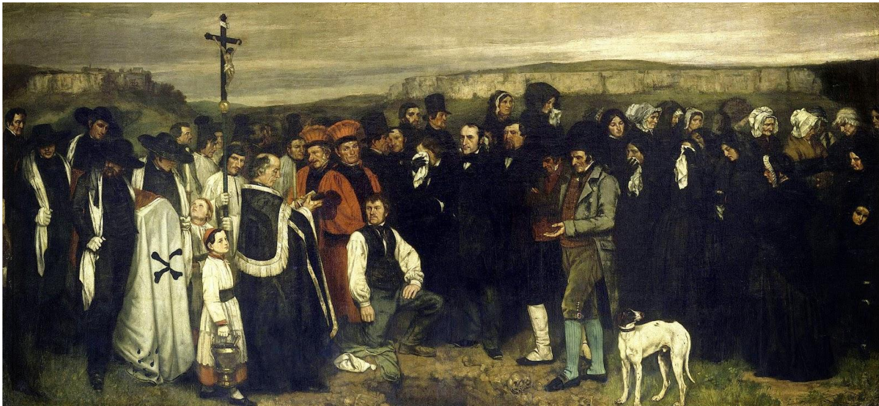
«Похороны в Орнани» 1850