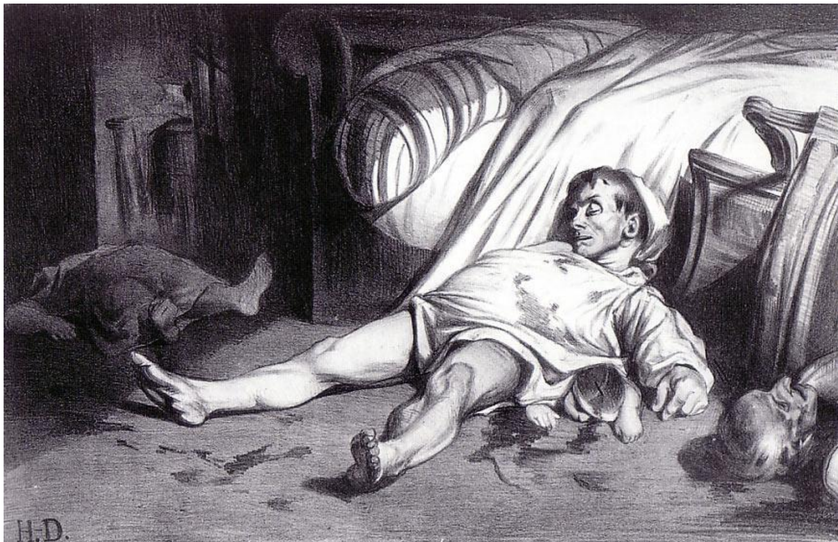
«Улица Транснонен» (1834 г.)