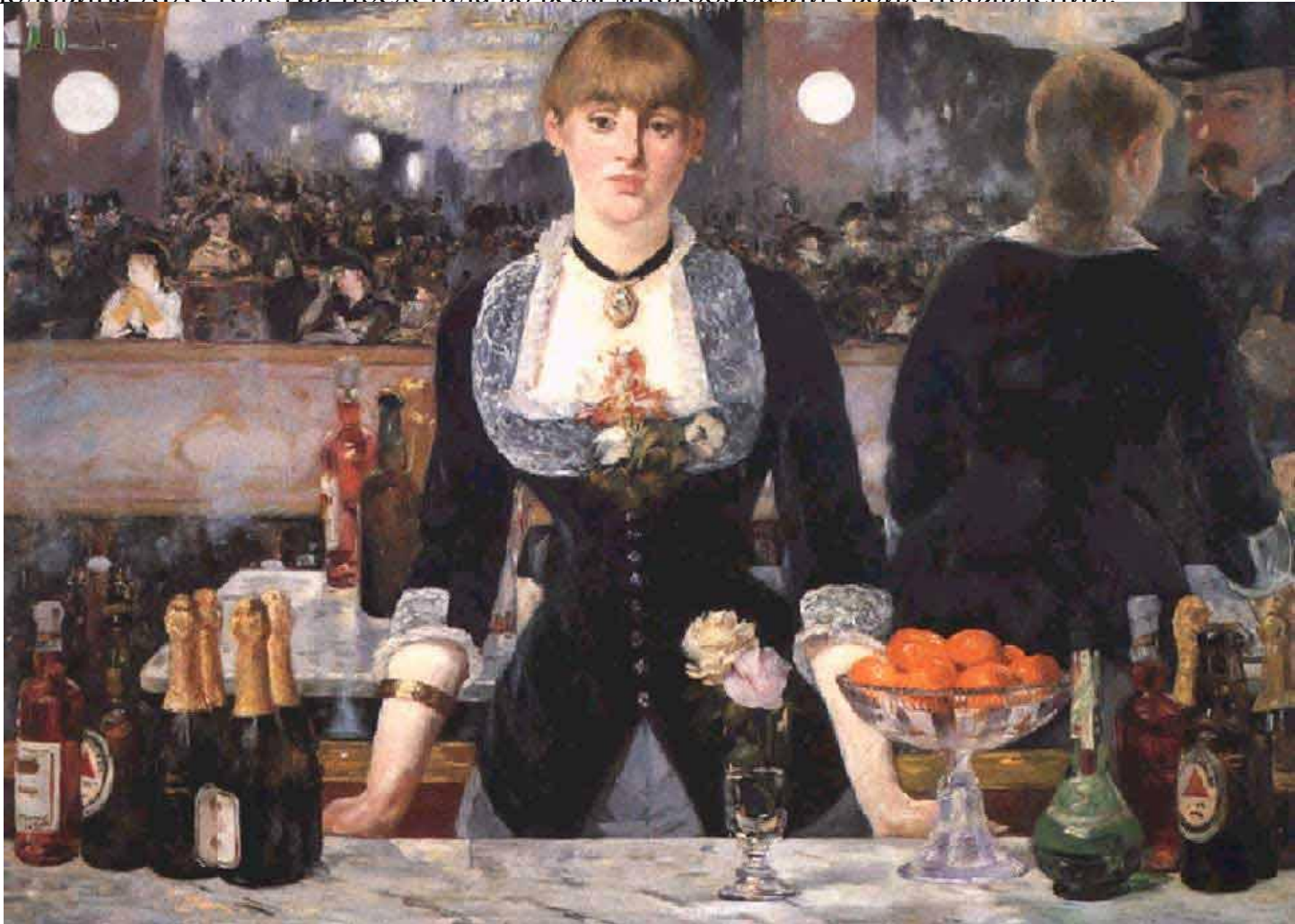
Бар в Фоли-Бержер. 1882