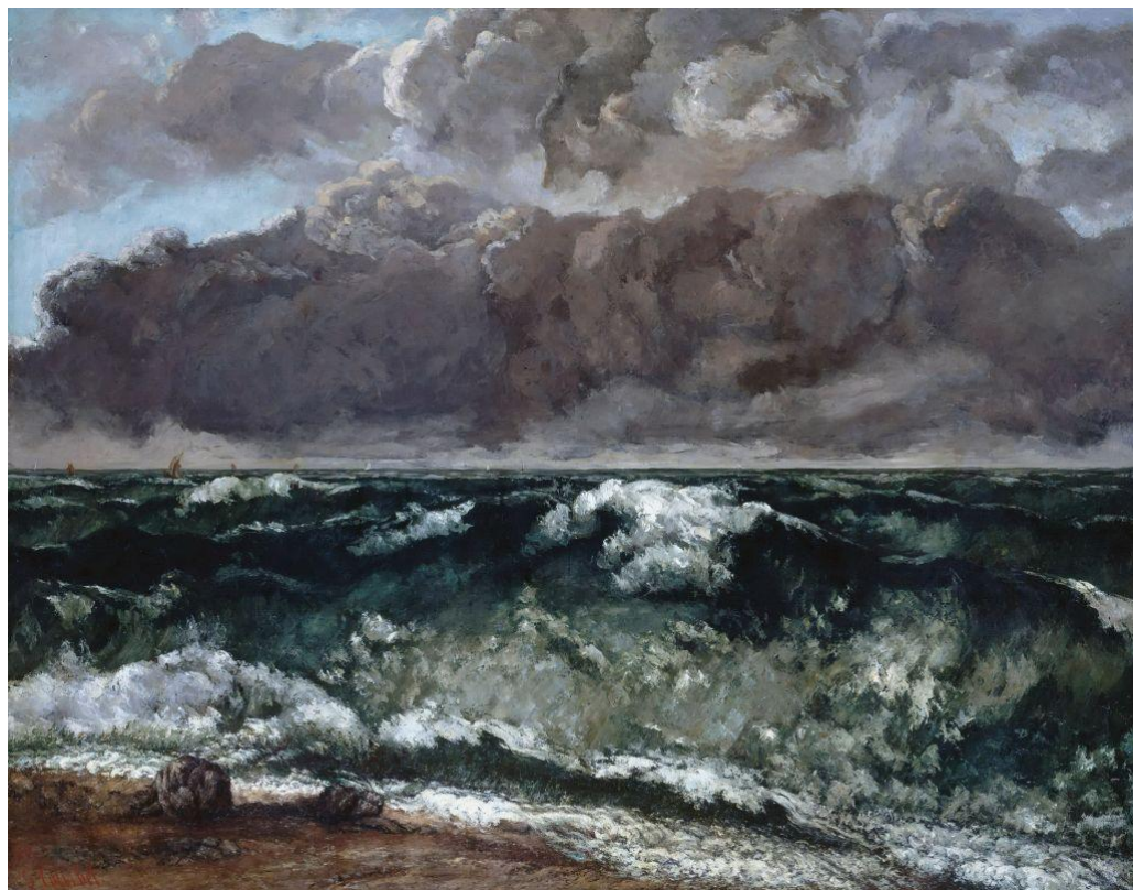
Гюстав Курбе. Волна. 1860