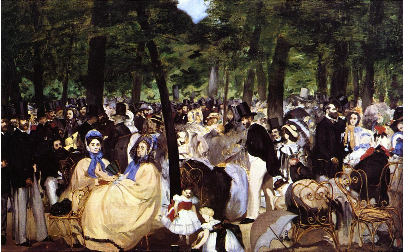
«Музыка в Тюильри», 1860 г.