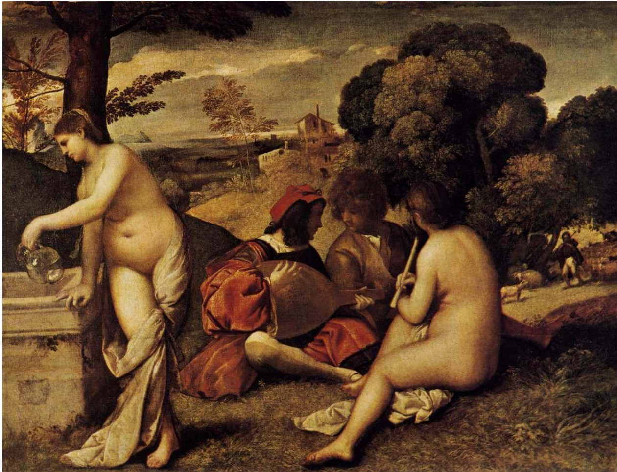
«Сельский концерт», Джорджоне, 1508