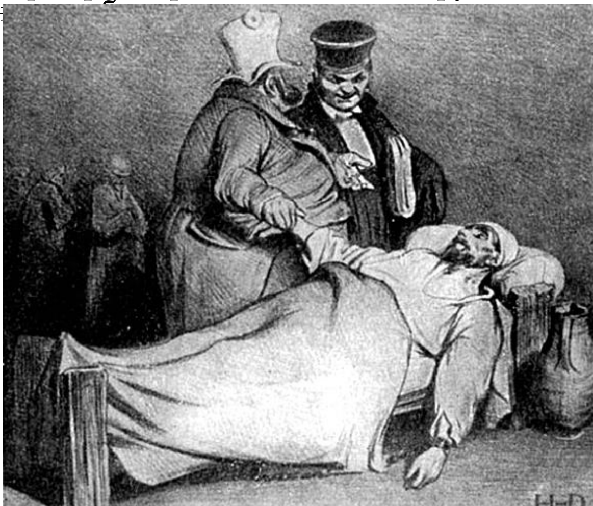
«Он нам больше не опасен», 1834 г.