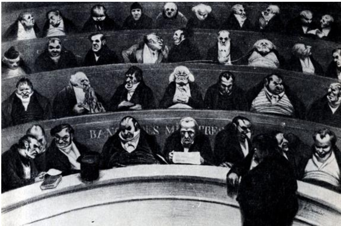
«Законодательное чрево»; 1834 г.