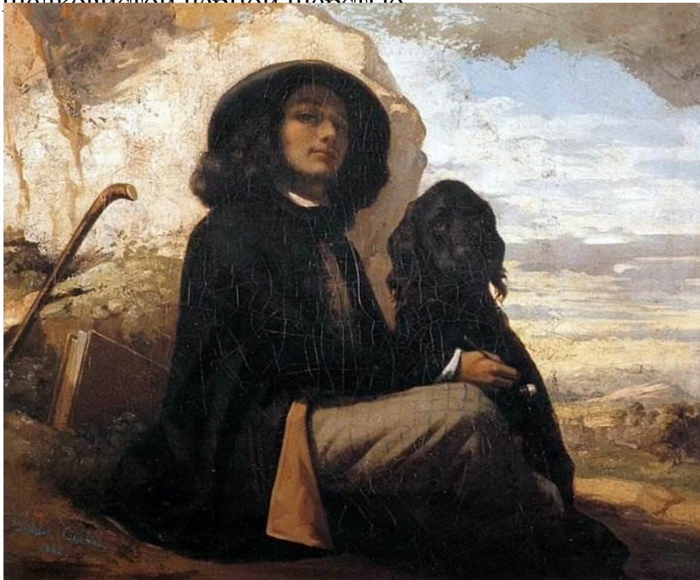
«Автопортрет с чёрной собакой» (1842 г.).