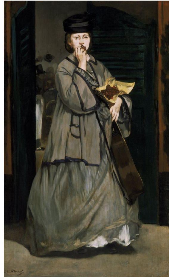
«Уличная певица», 1862 г.