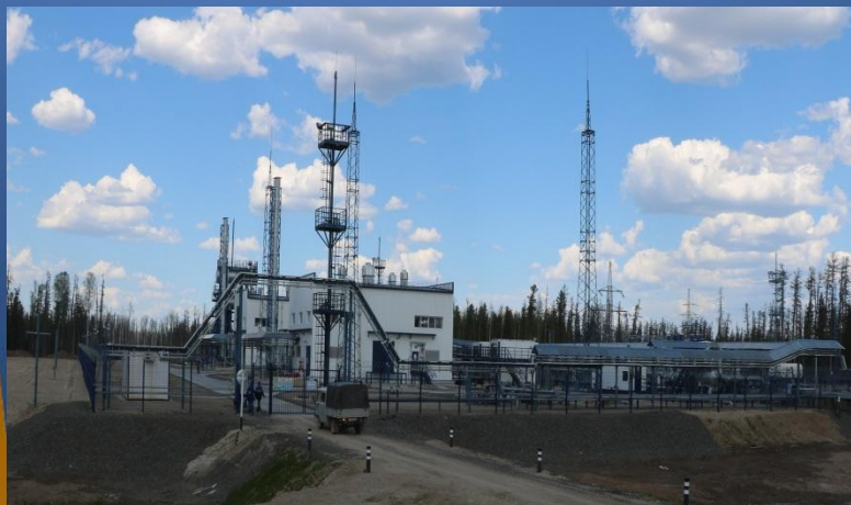
ГКС Шингинское месторождение