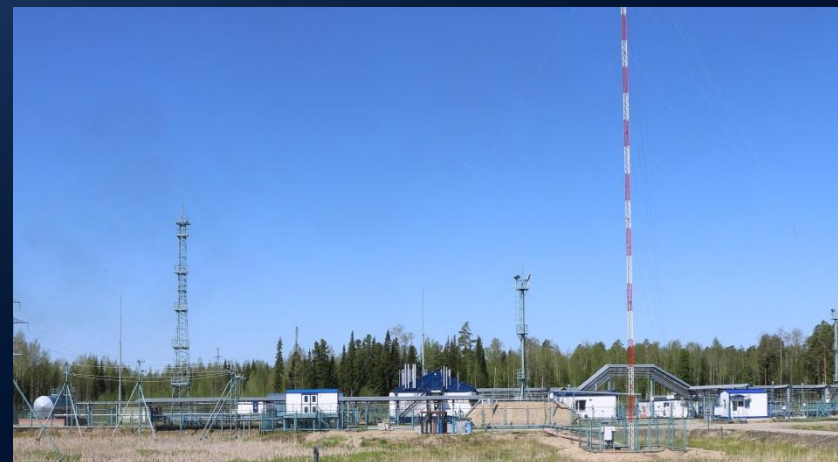
ПСП Лугинецкого месторождения.