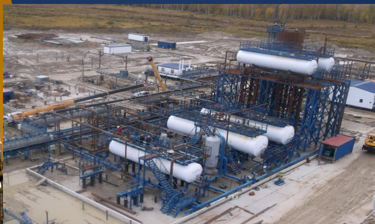
ДНС УПСВ Насосная внешней откачки нефти Арчинское