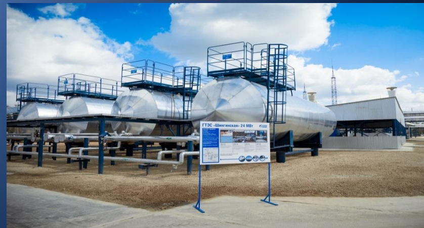
ГТЭС 24 МВт Шингинское