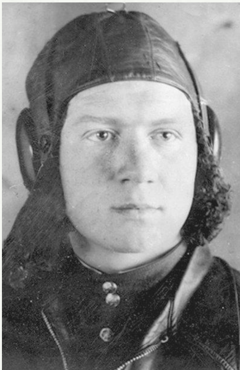
Кулаков Леонид Сергеевич. Гвардии полковник

Совершил 117 боевых вылетов, провёл 19 воздушных боёв, в которых сбил лично 6 самолётов противника.