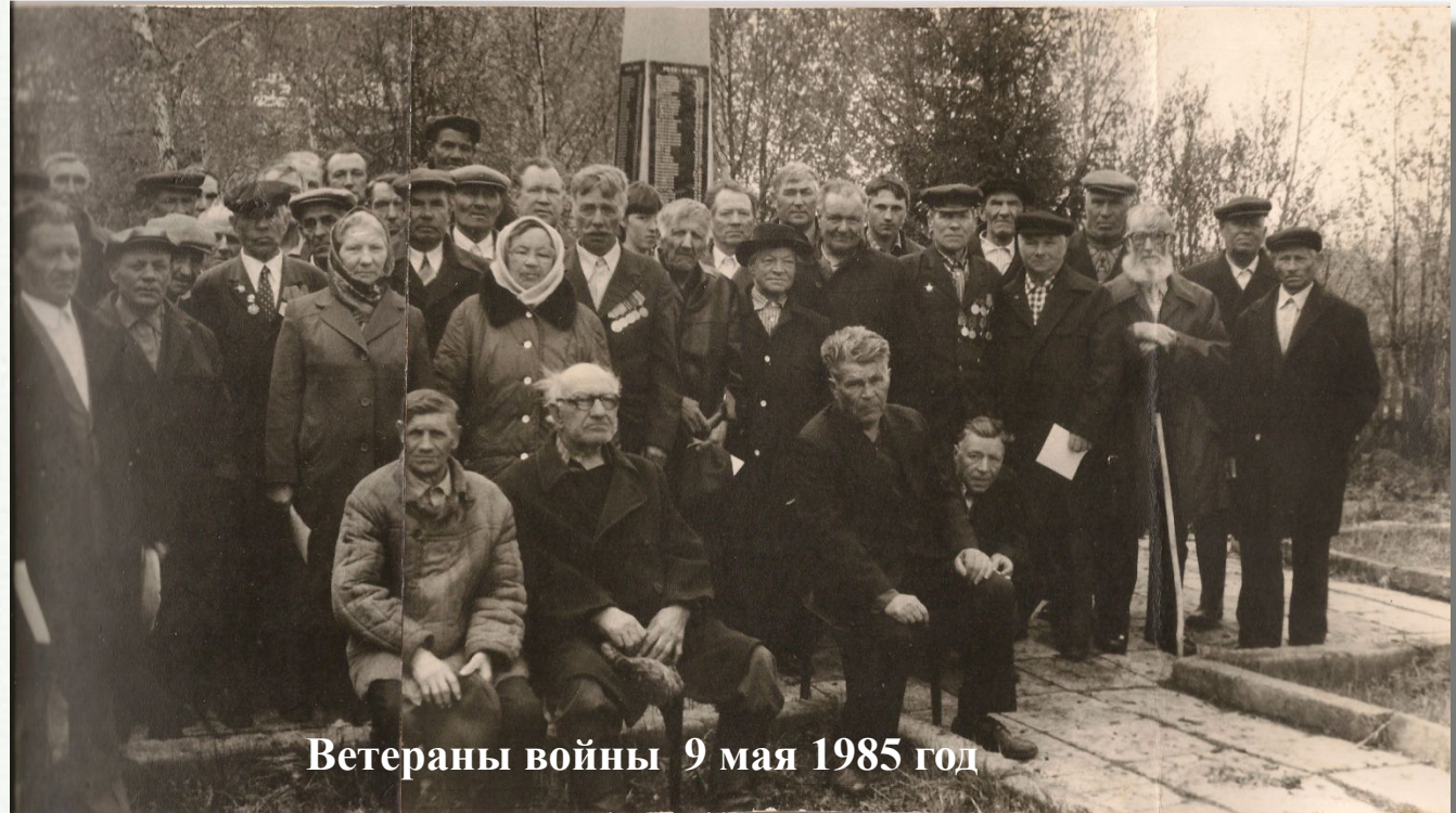
Ветераны войны 9 мая 1985 год

В годы войны 885 тысяч сынов и дочерей Нижегородской области героически защищали Родину. Из деревень Сосновка, Грязновка, с. Низовка ушло на фронт 520 человек, вернулось 270, из них в живых на сегодняшний день не осталось ни одного.