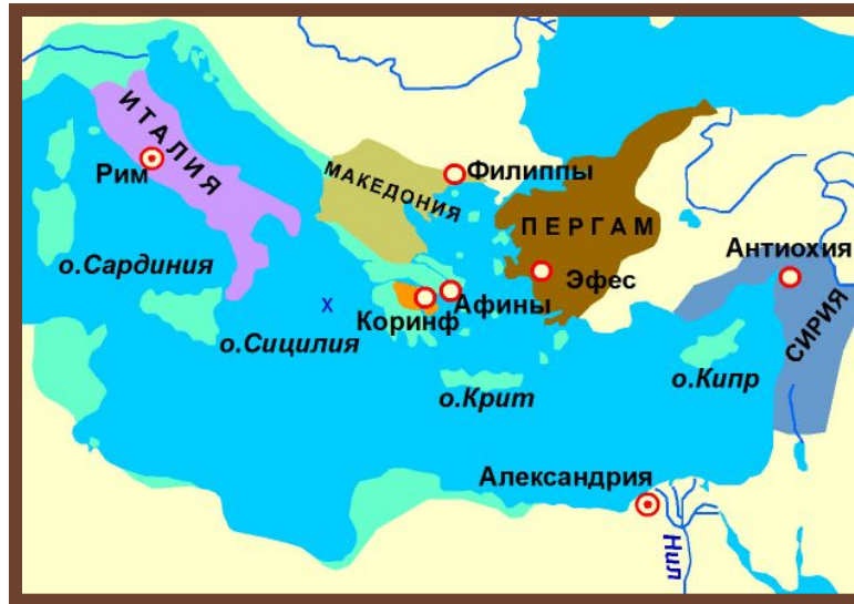
Рим и его провинции времен Республики

III вв. до н. э. – Рим подчинил всю Италию. Соперничество с Карфагеном.