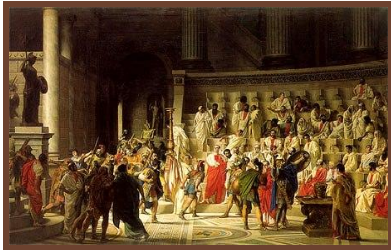
В римском Сенате

Во главе общины Сенат (родоплеменная знать – 100 патрициев).