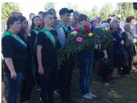
Лагерь труда и отдыха «Правнуки Победы»