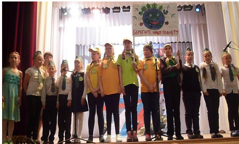
Фестиваль «Мы дети огромной планеты», посвященный Году экологии(2017)