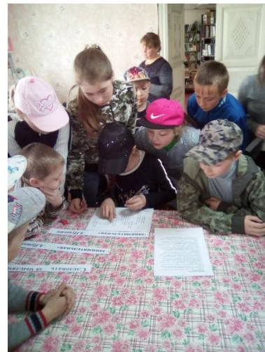
Фестиваль для детей и молодежи «Мы добровольцы России!»