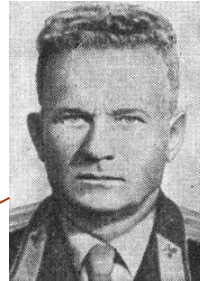
Пахомов А.К., Герой Советского Союза