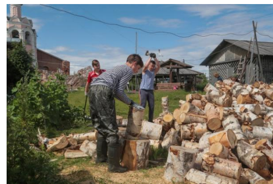
Лагерь труда и отдыха «Спасики»