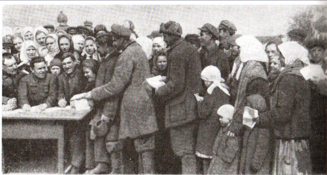
Подача крестьянами заявлений о принятии в колхоз. Борисоглебский район Центральной черноземной области. 1929 г. Фото

Нежелание крестьян вступать в колхозы решалось силой.