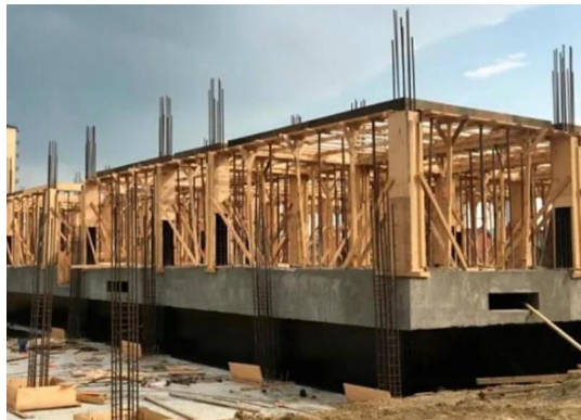
ШКОЛА НА 500 МЕСТ В Г. КАСПИЙСК МИКРОРАЙОНАХ 10