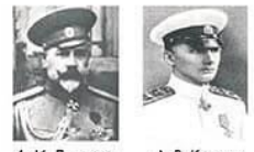
А. И. Деникин А. В. Колчак