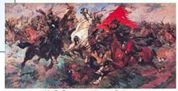
Н. С. Самокиш. Атака. Бой за знамя