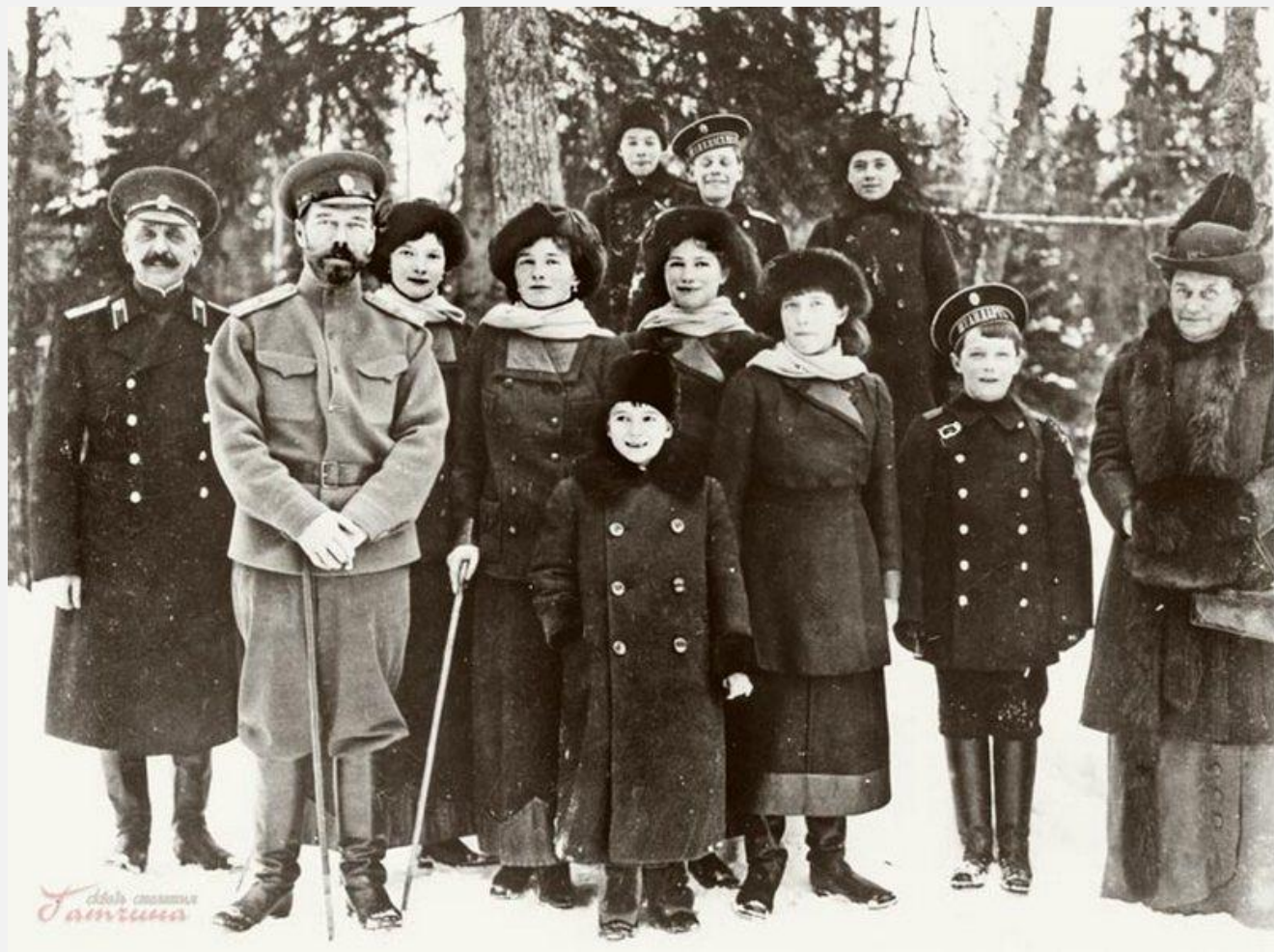
Расстрел царской семьи 17 июля 1918 Екатеринбург, Пермская губерния,