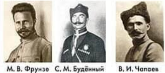
М. В. Фрунзе С. М. Буденный В. И. Чапаев