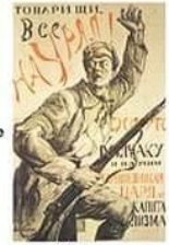
П. Киселив. Плакат «Товарищи, все на Урал!»