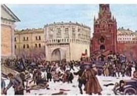
К. Ф. Юон. Вступление в Кремль отрядов Красной гвардии