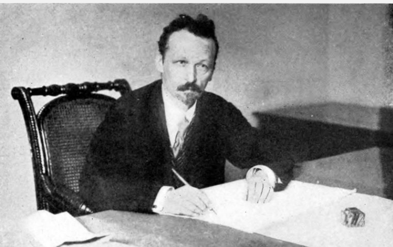
Н. И. Подвойский

В ноябре 1917 — марте 1918 года нарком по военным делам РСФСР