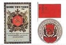
Конституция, государственный флаг и герб РСФСР в 1918 г.