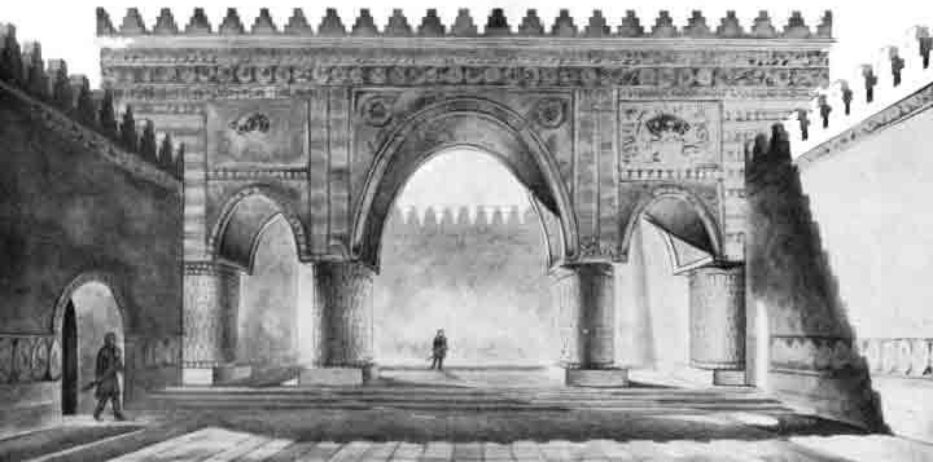
The iwān in V. A. Nil'sen's reconstruction